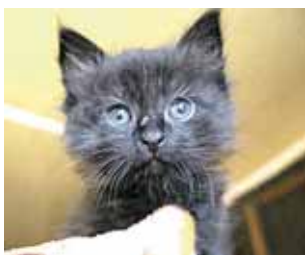
Bagis iš dėžės