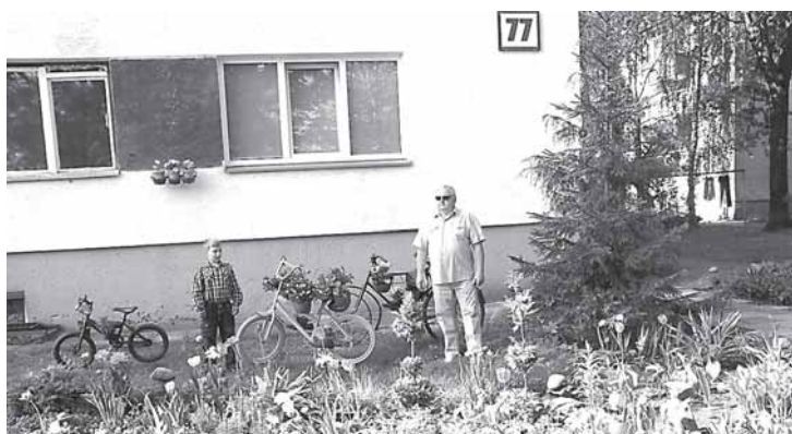
Daugiabutis M.K.Čiurlionio g. 77 garsus savo kiemo gėlynu su žydinčiais dviračiais