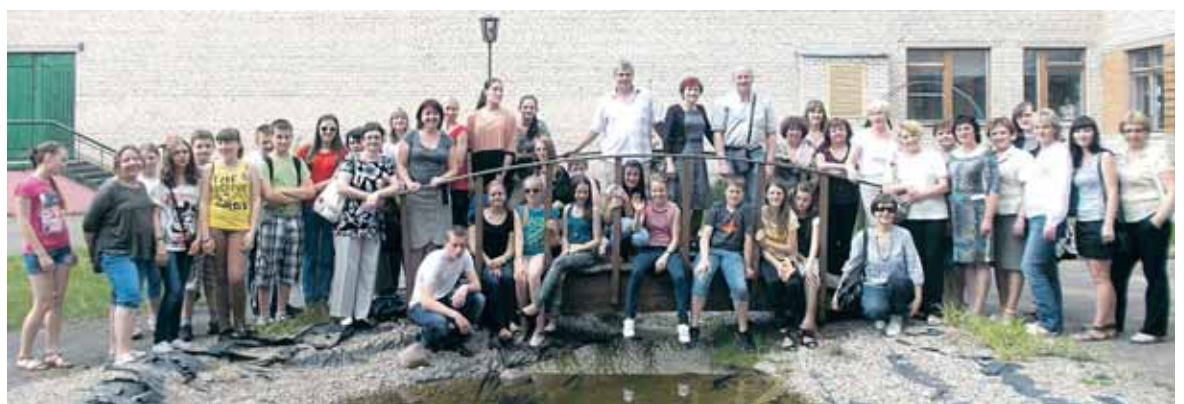
„Saulės“ pagrindinės mokyklos delegacija Gardine

Saulėtą gegužės 17-osios rytą Baltarusijos link pajudėjo autobu-