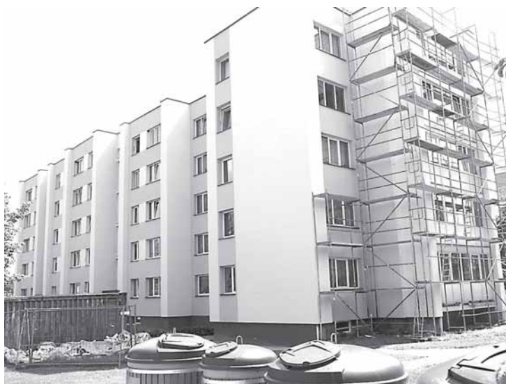
Dėl 3-ejus metus besitęsiančių ir vis nesibaigiančių renovavimo darbų neseniai „Druskoniui“ pasiskundė leipalingietė, gyvenanti daugiabučiame name Melioratorių g. 14, kurį administruoja UAB „Druskininkų butų ūkis“. Nuvykus į vietą, kalbinti šio namo gyventojai geranoriškai tikėjo, jog renovavimo darbai netrūkus bus užbaigti

Šio 12-os butų namo, kurį administruoja „Druskininkų butų ūkis“, gyventojai „Druskoniui“ tvirtino, kad imti iš banko paskolą renovavimui jiems itin kliudo apie 14 tūkst. Lt skola, kurią, padalintą visiems butams po lygiai, privalo gražinti. Jų pasakojimu, šios skolos didesnė dalis atsiradusi ne dėl daugiabučio M.K.Čiurlionio g. 77 gyventojų kaltės. Žmonės įsitikinę, kad į tokias skolas juos įklampino nuo senų laikų šio namo rūsyje įrengta boilerinė, aptarnaujanti kaimyninius 4 namus, ir jos techninės profilaktikos praplaukiant arba valant šildymo vamzdynus. Boilerinėje šalto vandens skaitikliai įrengti taip, kad rodmenų tarp įvado ir buto neatitikimo sąnaudos per metus siekia daugiau nei tūkstantį litų. Gyventojų manymu, būtent netobula vandens skaitiklių, sumontuotų ne ten, kur turėtų būti tikslūs patenkančio į butus vandens rodmenys, vieta užaugino didesnę dalį šios skolos, kuri kasmet ir kas mėnesį vis auga, nors dalį jos „Druskininkų butų ūkis“ minusavęs, tarsi pripažindamas, kad boilerinės namo rūsyje šalto vandens apskaitos sistema yra netiksli.