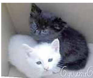
Sniegė ir Juodė, rastos dėžėje

Dėžėse dažnai pakuojami nereikalingi daiktai, šiukšlės, o kartais... gyvi kačiukai. Kažkam nesudrebėjo širdis dėžėje palikti bejėgius mažylius vienos Druskininkų sanatorijos teritorijoje. Jie buvo per maži, kad galėtų ištrūkti, jiems trūko oro, jie nusilaužė nagučius, bandydami surasti iš dėžės išėjimą. Tik stebuklo dėka po šalį einantis žmogus išgirdo tylų miuaukimą. Nedelsdamas padėjo šiems mažyliams. Kačiukai rūpestingos priežiūros dėka atsigavo ir dairosi naujų namų. Apie 1,5 mėnesio amžiaus Sniegei, Juodei ir Bagiiui, meilėms ir nepraradusiems pasitikėjimo žmonėmis, suteikite namus, kuriuose jie būtų mylimi. Dovanojant juos atsakingiems šeiminiškams, skiepi ir sterilizacijai bus suteikta nuolaida. Tel. 861865367, info@mazojiliza.lt Taip pat prašome atsileipti moterį, kuri gegužės 27 d. P.Cvirkos gatvėje rado 2 mažus (baltą ir rainą) kačiukus.