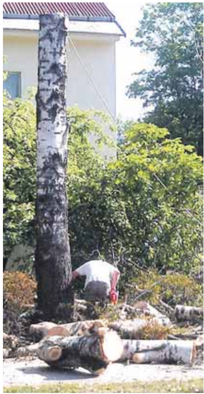
Kertamas beržas M.K.Čiurlionio gatvėje

Beatodairiškas senų medžių pjovimas visais metų laikais Druskininkuose jau tapo kasdienybe. Medžiai pjunami standartiškai, tvarkant viešąsias erdves, tenkinant gyventojų, verslininkų prašymus ir labai primityviai paaiškinant, kad medžiai buvo seni, ligoti, išpuvę, kėlė grėsmę. Leidimai pjauti pasirašomi lengvai, neatsakingai. Deja, nupjautų medžių kelmai dažnai rodo, kad medis buvo sveikas, gyvybingas. Seni medžiai, unikalūs savo dyžiu ir forma, suteikia išskirtinumo ir konkrečiai erdvei, ir visam miestui, nors ir neatitinta standartizuoto matymo ir tvarkymo kriterijų. Neabejotinai unikali savo dyžiu ir gražia forma buvo baltųjų tuopų trijulė Taikos g. skverelyje, klevas ir plačialapė liepa Nemuno sanatorijos teritorijoje (čia iš-