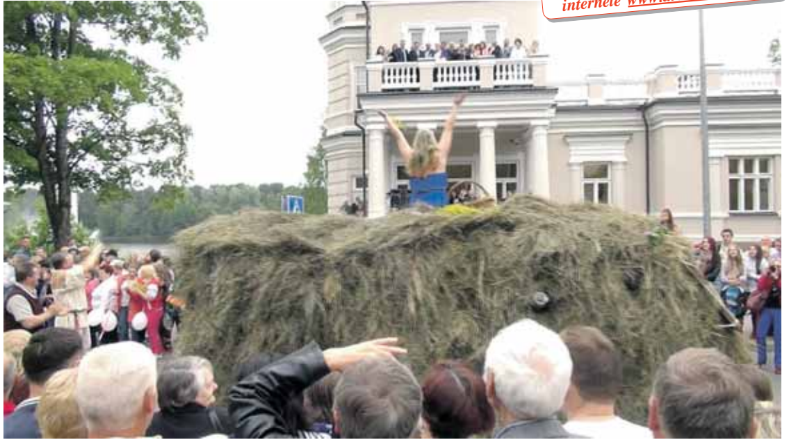
Valdžios viršūnėlė šventinėje eisenoje tautai mojavo iš balkono kaip sovietmečiu

Filmuotą reportažą žiūrėkite internete www.druskonis.lt