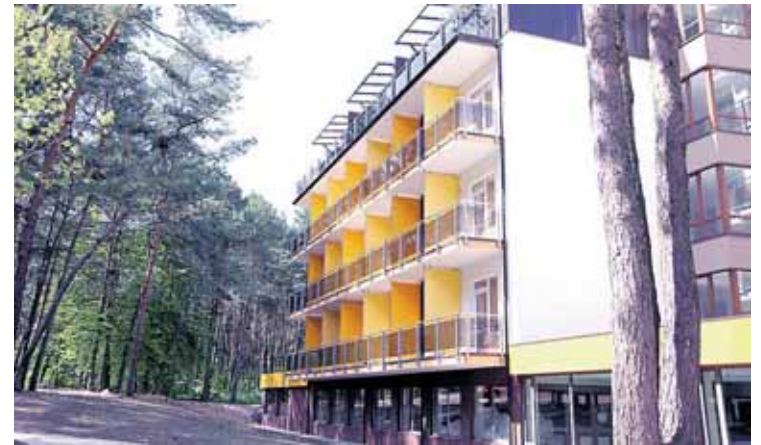
„Eglės“ sanatorija Birštone

Gegužės 22 d. Birštone pirmuosius svečius priėmė naujoji „Eglės“ sanatorija, kurioje vienu metu gali gydytis ir ilsėtis 320 žmonių. Birštono „Eglės“ sanatorija - Druskininkuose veikiančios to paties pavadinimo sanatorijos „sesutė“.