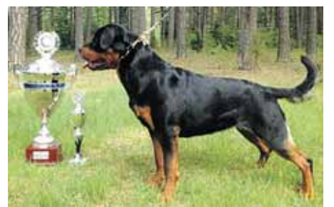
Laguna su pasaulio nugalėtojos taure

Stepanauskai patvirtina, jog tokie čempionatai visiems akivaizdžiai įrodo, kad rotveileris yra šeimos šuo, paklusnus ir ištikimai tarnaujantis šeiminkams, o nuomone, kad ši veislė yra agresyvi – visiškai klaidinga ir paskelbta neatsakingai. Lietuvos rotveilerių draugų klubas kasmet organizuoja rengi-