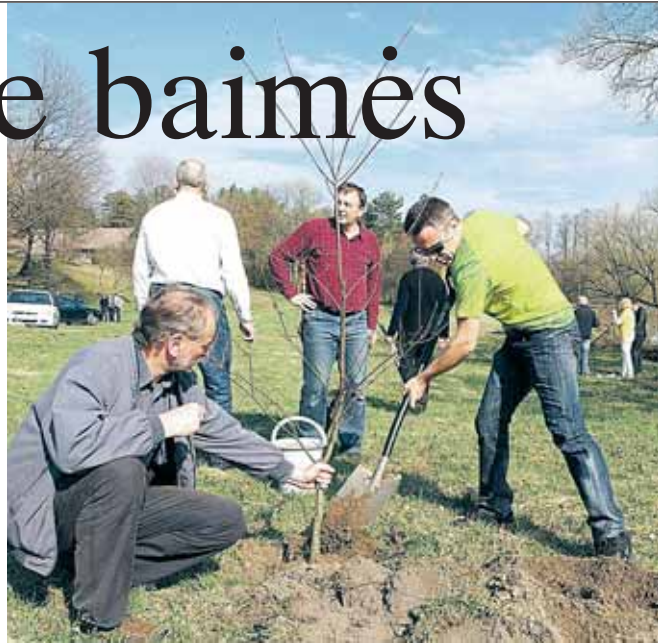
Ąžuoliukų sodinimas Sajūdžio 25-mečio proga prie Ratnyčios bažnyčios

S ajūdžio 25-mečio minėjimo renginiai prasidėjo visoje Lietuvoje. Ar Druskininkuose vis dar prisimenamas Sajūdis, ar judėjimo misija bei jėga - LAISVĖ, sutelkusi turtingą ir vargdieni, jauną ir seną, kaimietį ir miestietį, krikščionį ir netgi paklydusį ideologinį komunistą, teberusena mūsų širdyse? Ar skiriasi tas Laisvės supratimas anuomet ir dabar? Jei skiriasi, tai kuo?