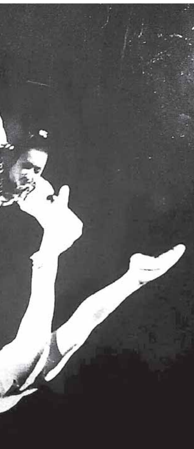
akrobatika ant lyno po cirko kupolu