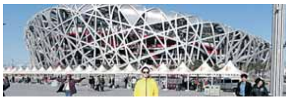
Olimpinis Pekino stadionas