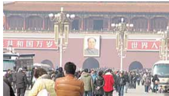
Centrinė Pekino aikštė