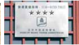
4-ių žvaizdučių tualetas