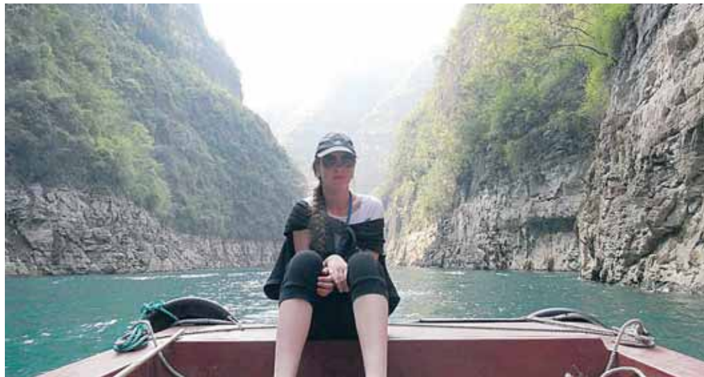
Viena išpūdingiausių – kelionė Jangdzės upe

Kai manęs paklausia, kas labiausiai nustebino Kinijoje, vadinu ne tik „Uždraustąjį miestą“ Pekine – senovės imperatorių rezidenciją, 8 tūkst. kilometrų besidriekiančią Didžiąją kinų sieną – vieną iš naujųjų septynių pasaulio stebuklų, terakotinę armiją ar Šanchajaus dangoraižių mišką.