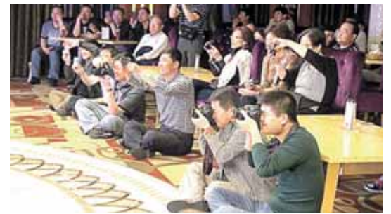
Kinai fotografuoja viską ir visur