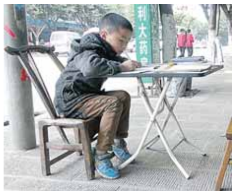
Vaikas ruošia pamokas gatvėje