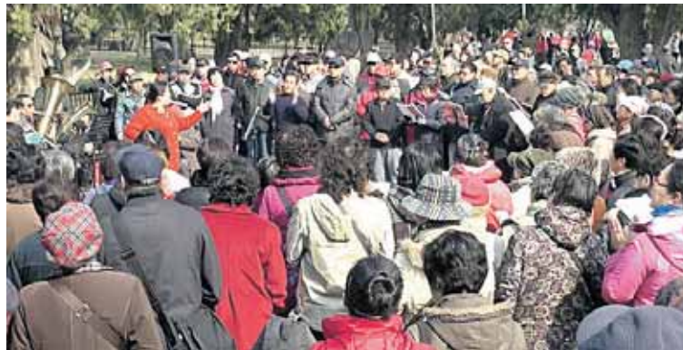
Parke susirinkę kinų pensininkai groja ir dainuoja