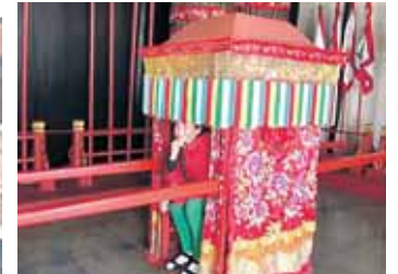
Kinų jaunamartės palankinas