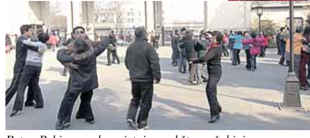
Rytas Pekino parke: vietoj mankštos – šokiai