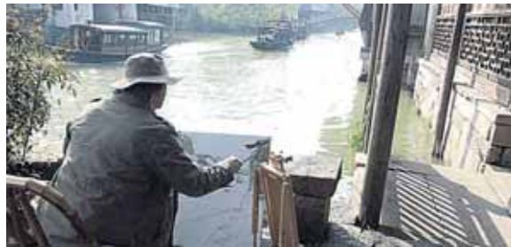
Viešbučiai ant vandens – tikra romantika

Vaikščiodama milijoninių miestų gatvėmis, negalėjau atsistebėti dviem dalykais – kur ne kur stryčiojančiais vaikais ir visus miestų parkus bei žaidimų aikšteles okupavusiais seneliais. Jūs neįsivaizduojate, kokių tik žaidimų ir pramogų neprišalvoja Kinijos žilagalviai! Kasdien nuo ankstyvo ryto į tenyškčių miestų parkus plūsta minios pensininkų. Jie ten šauniai pramogauja – šoka pramoginius šokius, mėto lankus, vandeniui ant grindinio piešia hieroglifus, medituoja, užsiima tai či, dainuoja, daro sudėtingus gimnastikos pratimus, griežia styginiais instrumentais, mezga ir siuvinėja. Čia tai bent senatvė gryname ore! Štai iš ko turėtų pasimokyti Druskininkų senoliai. Juk daugumos kinų buitis, pajamos gerokai kuklesnės nei mūsų, bet garbaus amžiaus žmonės ten sugeba džiaugtis gyvenimu, neužsidaro tarp keturių sienų.