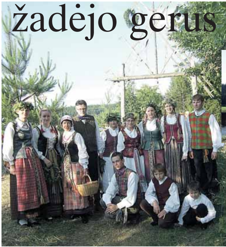
„Ryto“ gimnazijos „Racilukai“ Rasų šventėje prie Merkinės

Savaime suprantama, šventėme ne vieni. Be „Kukumbalio“ ir mūsų, dalyvavo Kauno raj. Palemono vid. mokyklos folkloro ansamblis „Bitula“ ir nemažai entuziastingų svečių. Šventė prasidė-