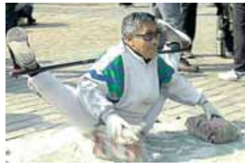
Sportuoja kinų senukai Kinijoje daug kas draudžiama