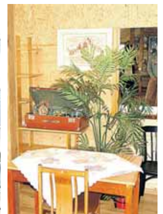
Originalaus interjero salės Klonio g. 14 fragmentas