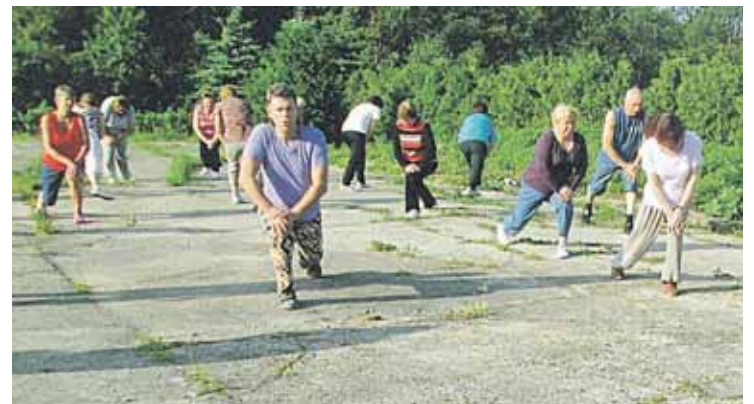
Gedimino vedama mankšta senjorams

Sveiko žmogaus akademija plėtoja savo veiklą rekonstruotose patalpose bei šalia esančiame 1 ha plote, kur išlikę buvusio Druskininkų daržininkystės ūkio vaiskrūmių ir vaismedžių plotai, daržvietės, šiltnamiai. Šioje UAB "Sovulo" nuomojamoje teritorijoje ekologiškai išauginti serbentai, obuoliai, slyvos, kriaušės ir kiti vaisiai, braškės, pomidorai, agurkai, cukinijos ir kitokios daržovės, melisos, levandos, pelynai, šalavijai, kelių rūšių mėtės, prieskoniniai augalai naudojami čia pat esančioje virtuvėje sveikam maistui pagaminti ir jį originalaus interjero susibūrimų salėje pateikti, nes vykusių ar vykiančių sveikos gyvensenos stovyklų dalyviai maitinami būtent tokiais ekologiškais patiekalais. Šią jaukią bei erdvią salę savo renginiams organizuoti jau atrado įvairios mūsų miestelio bendrijos. Tuo tarpu 1 ha kieme gausu ne tik ekologiškos augalijos, gėlių, patrauklių plastikos detalių, bet ir daug žaliosios vejos bei erdvės, kur galima organizuoti renginius, jaukiai pabendrauti šalia tvenkinio esančioje pavėsinėje, tiesiog atsipalaiduoti gamtos apsupty. Šiais privalumais po rekonstrukcijos pritaikytame viešbučio paslaugoms pastate Klonio g.14 bei jo kiemo erdvėje birželio mėnesį įsitikino Vilniaus Medardo Čoboto III amžiaus universiteto 60 senjorų, stovyklavusių apie 10 dienų Sveikos gyvensenos akademijoje. Kiekvieną rytą aikštelėje šalia viešbučio 60-80 metų senjorai pradėdavo G.Grigelio vedama sveikatinimo