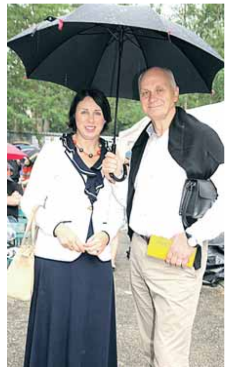
Žiūrovų neišgąsdino festivalį „patrikštijęs“ lietus