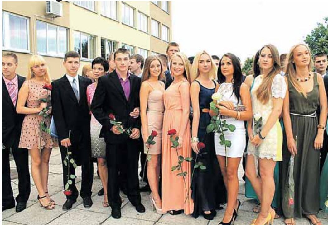
12 G klasė