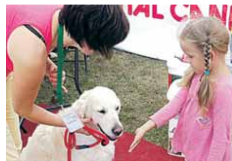
Pamokėle vaikams, kaip bendrauti su šunimis