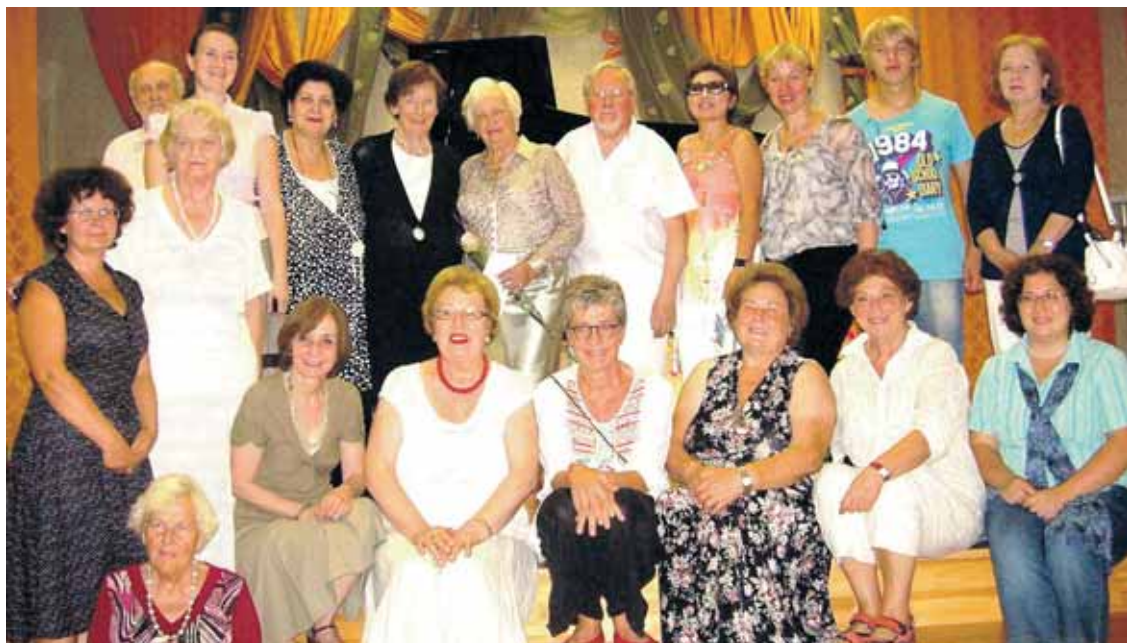
Iš festivalio archyvo: 2010 m. tarptautinio festivalio „Muzika be sienų“ organizatoriai ir dalyviai