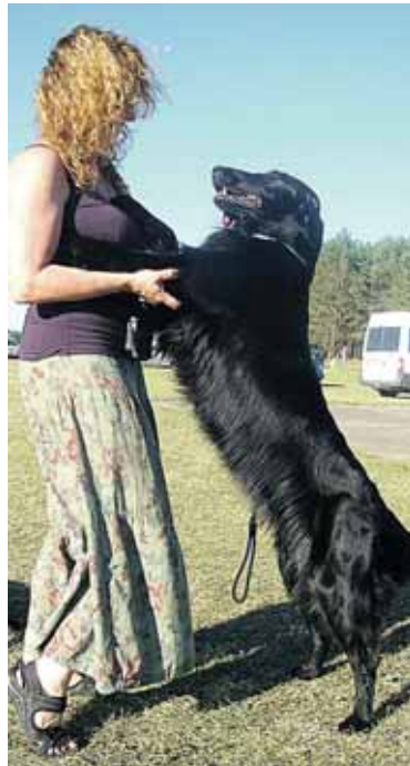
Retriveris, laimėjęs 3-ąją vietą gražiausiųjų finale