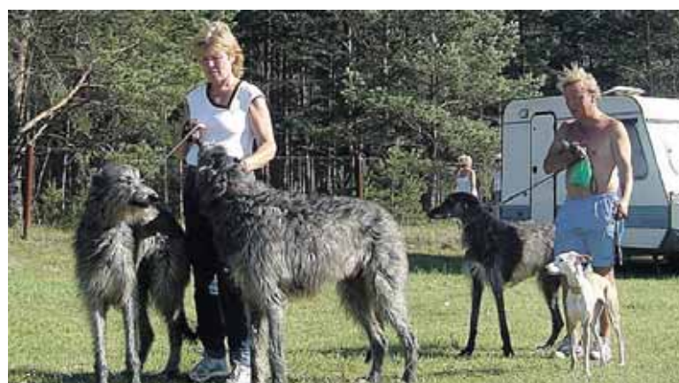
Antrąkart Druskininkuose škotų dirhaundų šeimyna iš Suomijos su savo šeimininiais