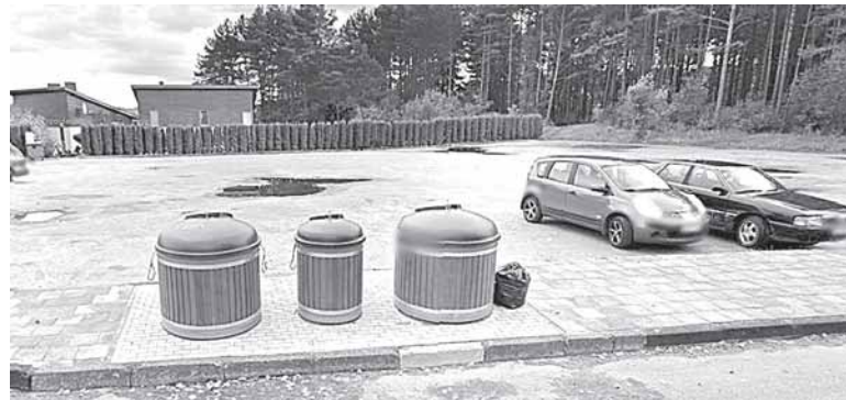
Taip atrodė atliekų surinkimo konteineriai prie gatvės. Kaip matyti, išmesti atliekas reikėjo ne nuo gatvės, o saugiai nuo aikštelės pusės