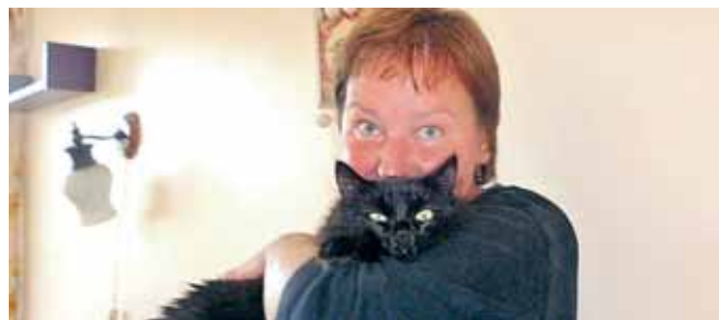
Su mylima katyte Krumce