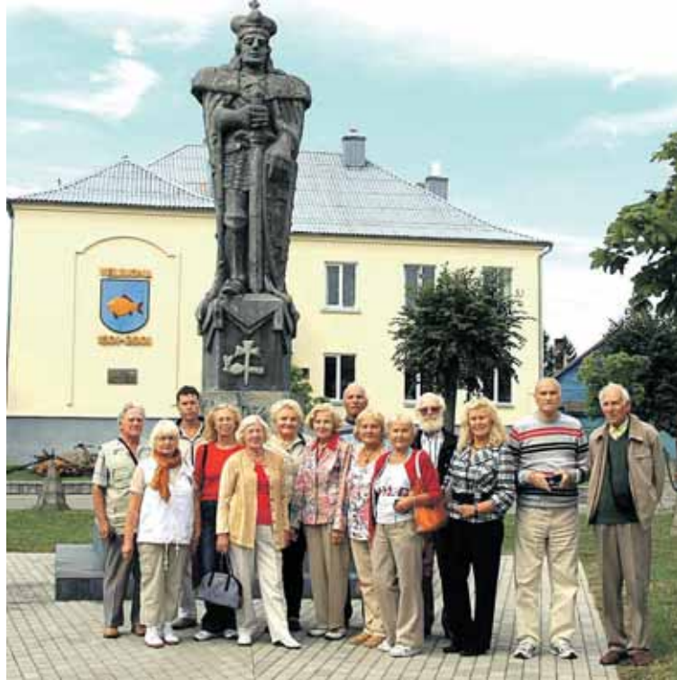
Prie Vytauto paminklo Veliuonoje

Už Kauno pasukome Panemunės keliu. Iš vienos kelio pusės - vaizdingas Nemuno slėnis, iš ki-