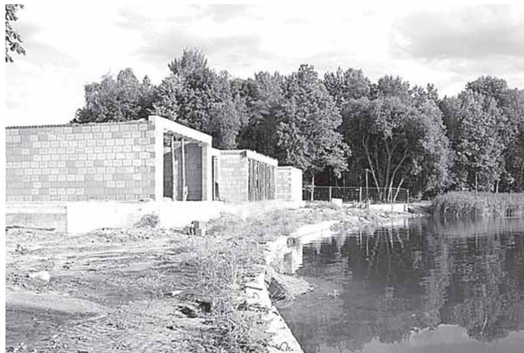
Suformuota sienelė (krantinė) ant vandens linijos

U ž Europos Sąjungos pinigų su tvarkytame Vijūnėlės parke, netoli viešojo paplūdimio, ant tvenkinio kranto, šią vasarą ėmė sparčiai kilti didžiulio namo pamatai. „Kas čia bus? Gal koks restoranas?“ – klausinėja vieni kitų vietiniai, būriais traukiantys pasižiūrėti Vijūnėlės parke spėriai vykstančių statybų. Ir nustersta, išgirdę, kad šis objektas bus privatus namas. Kur jau ten namas: pagal kylančių pamatų kontūrus – tikri caro rūmai!