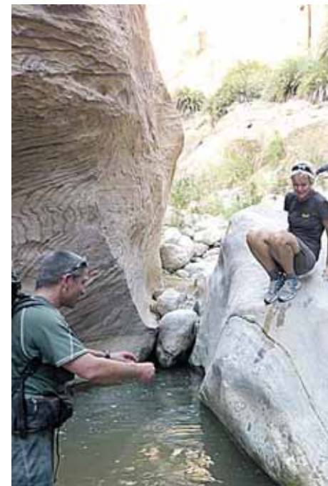
Jordanijoje, pėsčiomis per vandeningus k...

- Lietuvoje dirbau rimtose pozicijose. O kai atvažiuoju į Izraelį, supratau, kad dabar turėsiu ilgas atostogas. Smagu, aišku, buvo pirmą mėnesį, o paskui tos užsitęsę atostogos virto tikru galvos skausmu: kaip galima gyventi nieko neveikiant, neturėti jokio plano, neiti į biurą 8 valandą ryto? Apie galimybę įsidarbinti Izraelyje nepuoselėjau vilčių, nes įsidarbinimo pro-