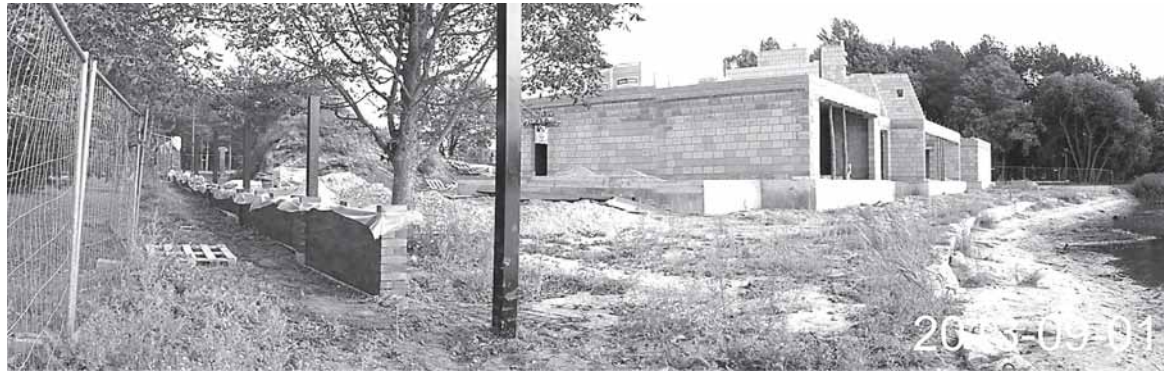
Kyla mansardinis aukštas. Vandens lygis tvenkinyje, pradėjus žemsiurbei dirbti visą parą, per mėnesį nukrito apie 0,9 m

Vijūnėlės parko teritorijoje, ant tvenkinio kranto, sparčiai šią vasarą pradėtas statyti didžiulis privatus namas domina ne tik druskiniečius, besistebinčius, kas gi tas laimingasis, gavęs savivaldybės palaiminimą rėstis šitokius rūmus rekreacinėje kurorto zonoje. Prabangaus namo statybos aplinkybes nagrinėja ir statybos inspektoriai.