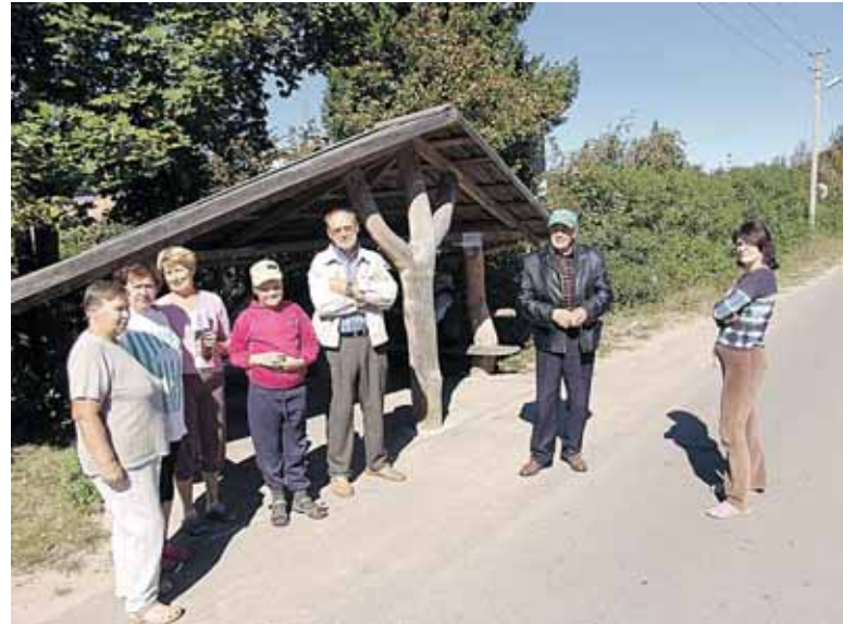
Rugsėjo 7-ąją Jaskonių sodininkus subūrė autobusų stotelėje pakabintas skelbimas, kviečiantis aptarti šiukšlių rūšiavimo ir išvežimo problemas

Be abejo, mūsų žmonės įpratę šiukšles iš savo sklypų išgabenti, kai mažai pašalinių akių mato, kur jas supila, nes tokiu būdu paprasčiausia savo sklypą apkuopti ir jokios aplinkosaugininkų baudos negresia. Deginti atliekas savo sklypuose – rizikinga, nes kaimynai gali ugniagesius iškviešti. Pagaliau tai oficialiems reikalavimams prieštarauja. Susibūrę autobusų stotelėje Jaskonyse sodininkai neneigė, jog prie buitinių atliekų konteinerių ne tik žaliųjų atliekų krūvos kyla, bet ir nereikalingi baldai ar nusidėvėjusi bui-