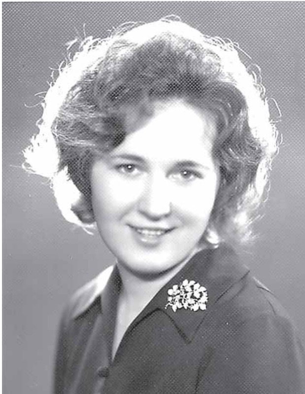
1975 m. Kauno medicinos instituto studentė