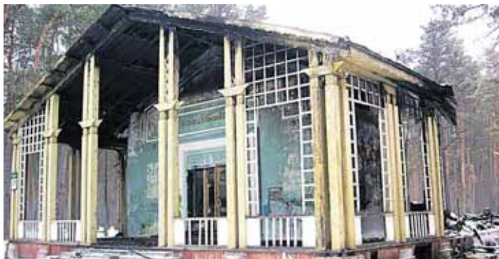
Buvęs kino teatras „Voveraitė“

rybos daugumos sprendimu jau nustatyta pradinė 7 mln. Lt nuomos kaina trisdešimčiai metų, atsižvelgiant į tai, kad viso projekto numatyta įrengimo kaina yra apie 13 mln. Lt, o patys keltuvai, pasak savivaldybės informacijos, tarnaus kaip taršą kurorte mažinanti priemonė.