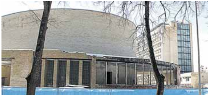
Buvusi „Nemuno“ sanatorijos koncertų salė

Savivaldybės oficialios internetinės svetainės dalyje „Pasiūlymai investuotojui“ jie kviečiami atkreipti dėmesį į mūsų regiono prioritetinius objektus. Pirmuoju numeriu pažymėtas investicinis projektas „Druskininkų aerodromo atnaujinimas ir plėtra“. Druskininkų savivaldybė ieško finansavimo šaltinių rekonstruoti esamą, prieš kelis dešimtmečius eksploatuotą, o šiuo metu tik epizodiškai mėgėjų reikmėms naudojamą gruntinį Druskininkų oro uostą. Antruoju numeriu pažymėtas prioritetas – kultūros, konferencijų, viešbučio komplekso T.Kosciuškos g. įrengimas. Jį planuoja sutvarkyti pati savivaldybė, o privatūs verslo subjektai kviečiami investuoti į 1000 vietų apgyvendinimo korpuso, ekonominės klasės viešbučio, konferencijų centro, maitinimo ir kitų verslo objektų įrengimą, vadovaujantis viešosios ir privačios partnerystės principais. Tai gerai žinomas sanatorijos „Nemunas“ kompleksas, kuris po galimai nesėkmingo viešo nuomos konkurso dabar skaidomas detaliuoju planu į mažesnius ir patrauklesnius atskirus objektus. Trečiuoju numeriu investuotojai laukiami savo lėšomis atnaujinant istorinį sveikatingumo parką ir jame esančius pastatus, kuriam ES bendrijos paramos lėšoms įsisavinti. Panašiai kaip uždarytų slidinėjimo trasų atveju, kuomet savivaldybė, tarybos daugumos sprendimu Nr.T1-289, sutartimi įsipareigojo 2010-2011 metais sumokėti UAB „Stamitai“ iš viso 3 mln. 600 tūkst. Lt už geranorišką bendradarbiavimą vystant Druskininkų kurorto turizmo infrastruktūrą bei užda-