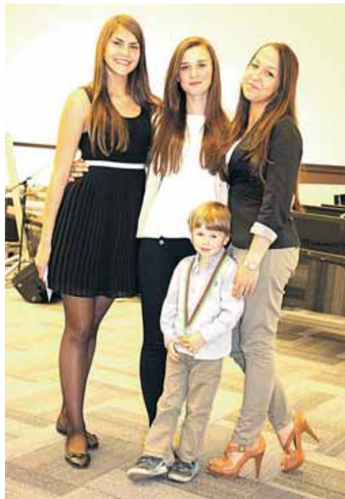
Druskininkų moksleivės platino loterijos bilietus