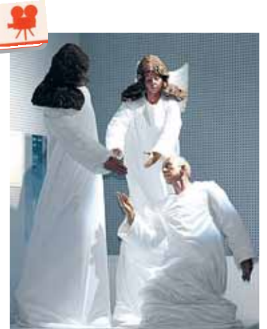
Pinigai buvo renkami skulptūrai „Lozoriau, kelkis“

Filmuotą reportažą žiūrėkite internete www.druskonis.lt