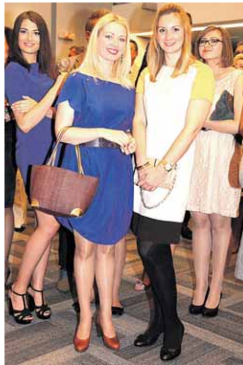
Šventinio renginio akimirka