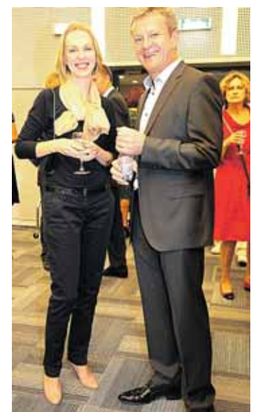
Šventinėje vakarieneje svečiai buvo puikiai nusiteikę