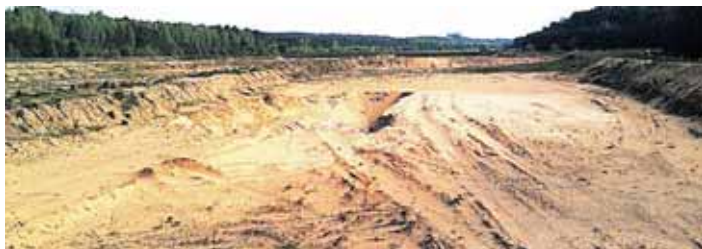
Taip dabar atrodo Druskininkų aerodromas