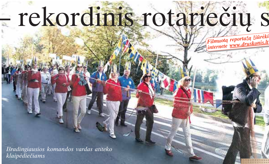
Išradingiausios komandos vardas atiteko klaipėdiečiams

Filmuotą reportažą žiūrėkite internete www.druskonis.lt