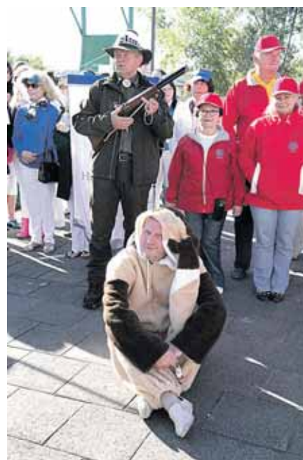
Rokiškio komanda atsivežė savą „kiškį“