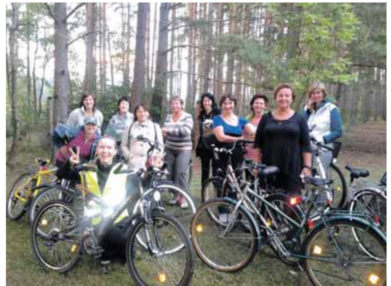
Dviračiais su draugėmis

- Tai nėra labai paprasta. Tiesiog ilgainiui perpranti svarbiausias darbo situacijas, igauni pasitikėjimą, tada jau gali įveikti visa kita. Laikiausi vienos labai svarbios taisyklės - nežiūrėk į žmogų iš aukšto - susilygink, jei reikia, leisk jam išsikalbėti, negailėk laiko pavaldiniui - tai geriausia investicija į darbinį santykių harmonizavi-