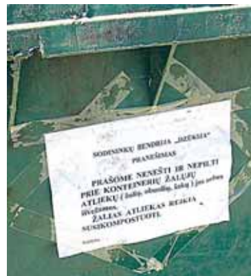
Daug kur Jaskonių sodų bendrijoje mirga skelbimai, kad žaliųjų atliekų krauti į konteinerius negalima