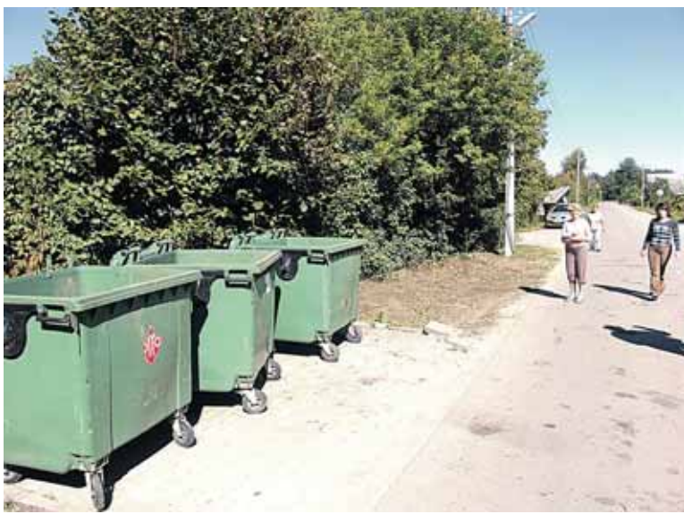
Prašėjusį savaitgalį žaliųjų atliekų krūva prie buitinių atliekų konteinerių Jaskonių sodų bendrijoje buvo skubiai išvežta

ribius ar aplinkinius miškus, kur neretai išpilamos sodo ir daržo atliekos. Susibūrusių paskaičiavimu, abiejose Jaskonių sodų bendrijose sklypus turi apie pustrčio šimto savininkų, tad ir atliekų gausu, ypač rudenį.