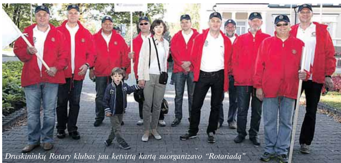
Druskininkų Rotary klubas jau ketvirtą kartą suorganizavo „Rotariadą“