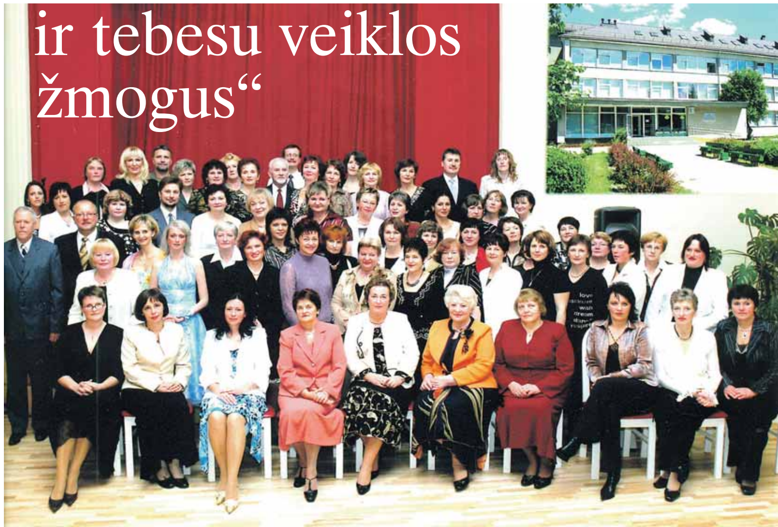
Druskininkų pirminės sveikatos priežiūros centro kolektivas įstaigos 10-ies metų sukakties šventėje 2007 metais