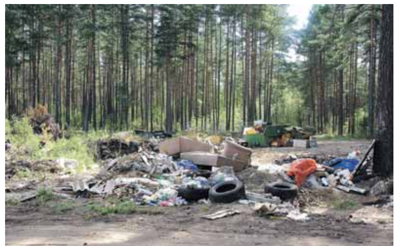
Stambiagabaričių atliekų aikštelėje, esančioje netoli nuo „Dainavos“ sodų bendrijos, situacija nesikeičia, nes į ją gabenamos įvairiausios atliekos