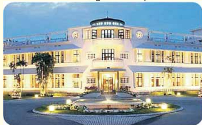
Pervalko SPA projektas