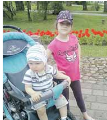
Karolio globėja – ir sesutė

litas prie lito. Tik pas mus – centas prie cento.