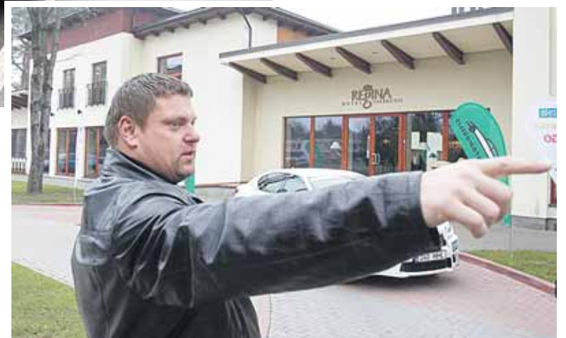
Dar vienam rekordui užsimojęs Ž. Savickas - jau Druskininkuose