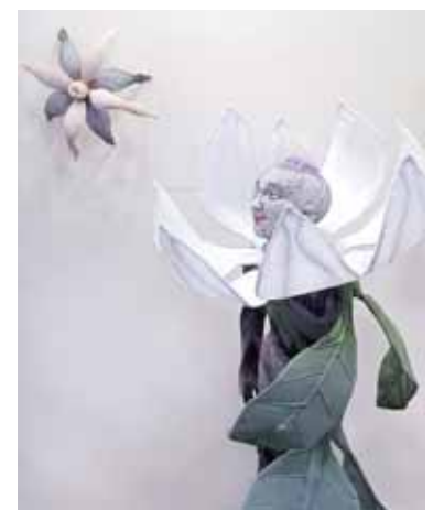
„Magnolija“ ir „Pumpurėlis“ Hamburgo galerijoje