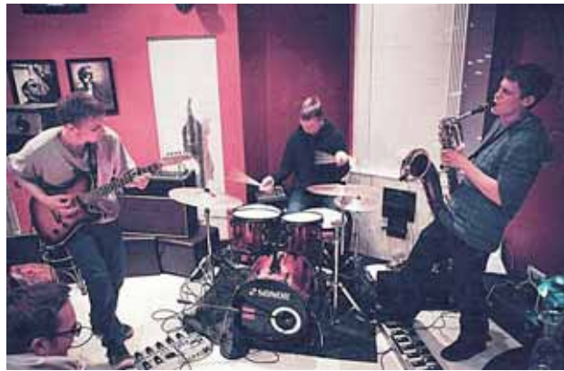
„Sheep Got Waxed“

- Vienąsyk išsitarei, kad kartu su grupe už susimestus pinigus nusipirktu „passatu“ vasarą keliauot per Europos šalis ir gro-