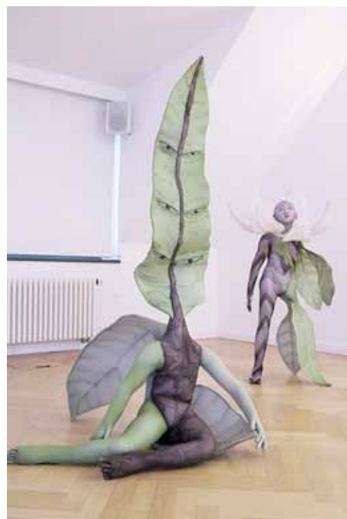
„Augalas“ ir „Magnolija“ Lietuvos ambasados galerijoje Berlyne