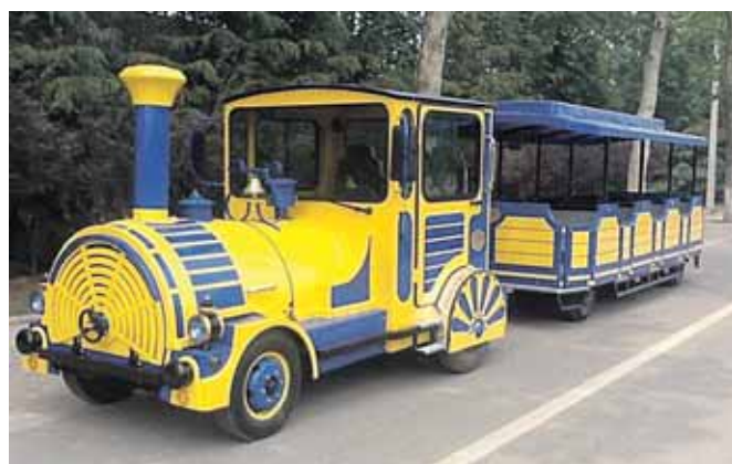
Kurorto valdžia šįsyk sumanė įsigyti traukinuką ant ratų, panašų į tą, kuris šventiniu laikotarpiu kursavo Vilniaus Gedimino prospekte