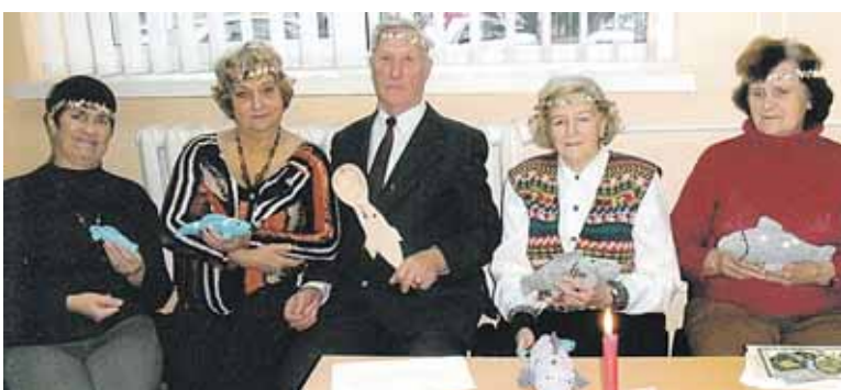
„Kraitės“ nariai su savo rankų darbo žuvimis

Kaip teigia anglų poetas T. Coleridge, „Vaizduotė keičia gyvenimą, – labiau pasitikėkite vaizduote ir ja gyvenkite“. Tad mums buvo įdomu kurti suvenyrus, kuriuos siūlė vaizduotė, patirta popiečių, skirtų pelėdai, žuvytei, boružei, metu. Kalbėjome apie pelėdą liaudiškuose tikėjimuose ir liaudies kūryboje. Prof. M. Gimbutienė teigia, kad pelėda buvo viena iš seniausių dievybių. Jų pėdsakų yra geležies amžiaus papuošaluose.