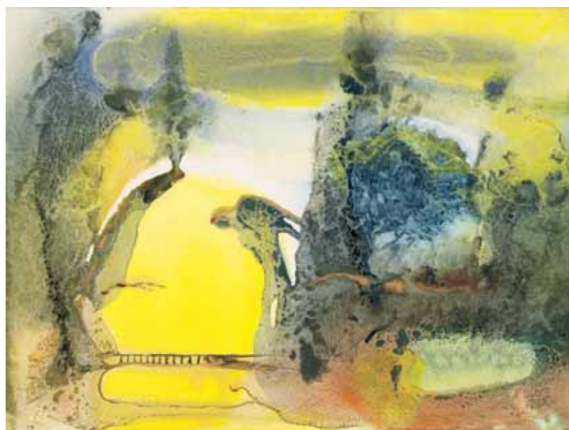
E. Šturkaitės kūrinių: Paslaptinis lieptas