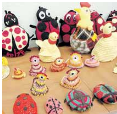
„Bočių“ bendrijos etnoklubo „Kraitė“ narių rankdarbiai