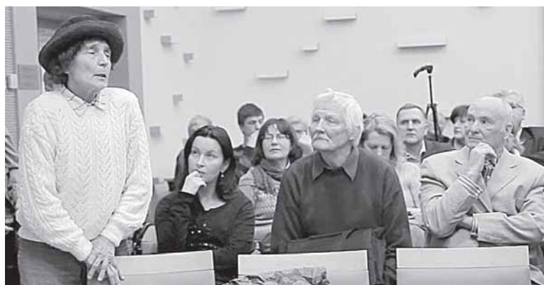
Druskininkiečiai daug kalbėjo apie brangią šilumą ir priverstinę renovaciją