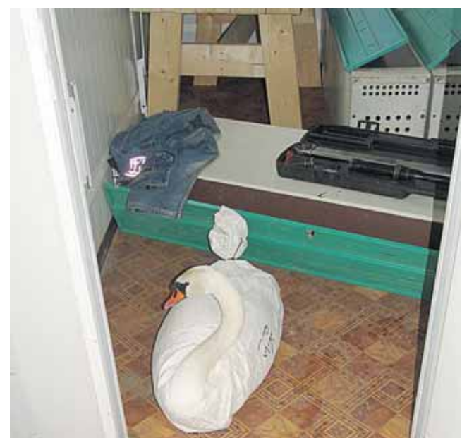
Sausio 17 d. išgelbėta gulbė statybininkų buitinėse patalpose