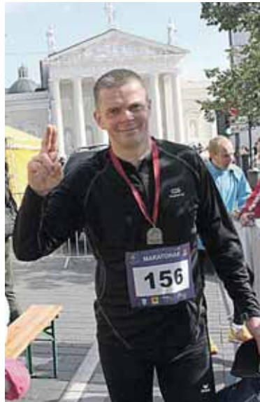
Po Vilniaus maratono finišo

riato kolektyvas šiek tiek turėjo pažinoti mane, nes Druskininkų PK yra Alytaus AVPK struktūrinis padalinys, o dirbant vienoje įstaigoje, vienoje sistemoje, visada būna bendrų renginių, seminarų, nemažai kitų bendrų darbų.