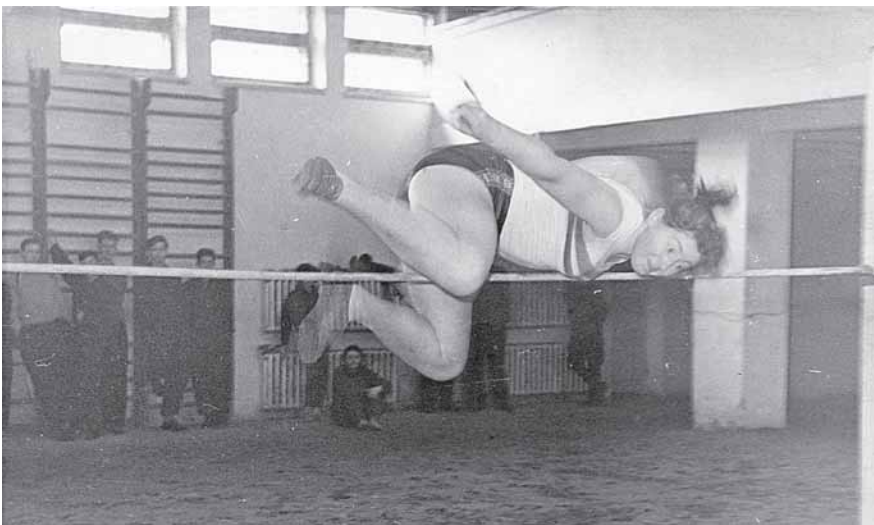
Vidai jaunystės laikais nebuvo lygių šuolių į aukštį rungtyje