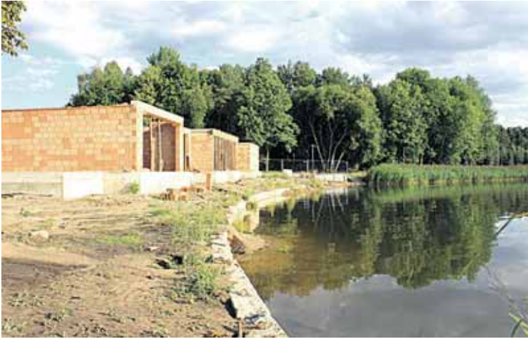
2013-07-31. Iš gelžbetonio blokų buvo suformuota sienelė (krantinė) ant vandens linijos. Pastato užstatymas tuomet buvo 3,8 m nuo vandens linijos