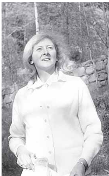
Vidai nei dabar, nei jaunystės laikais (nuotraukoje) nestigo energijos ir veiklos