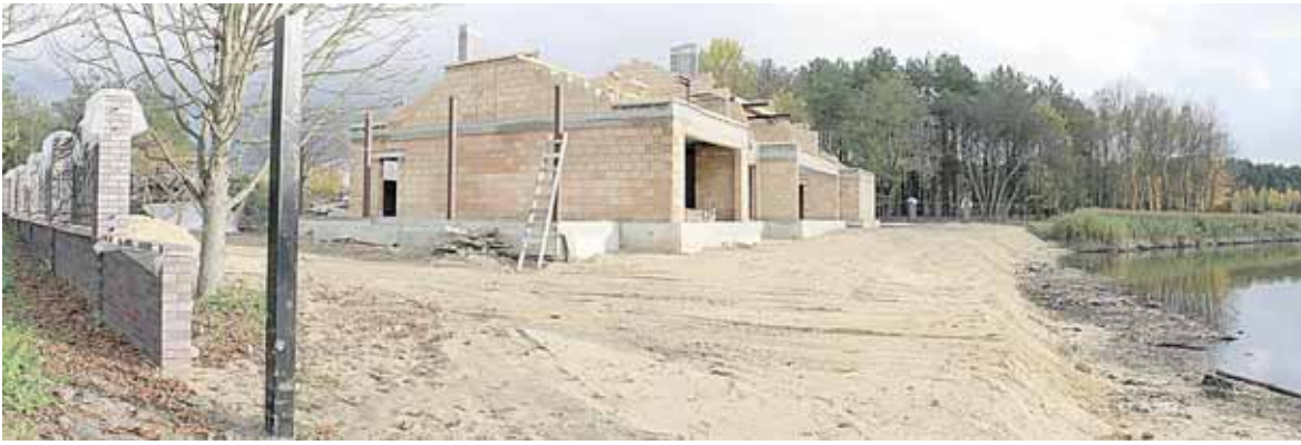
2013-10-15. Krantas suformuotas iš atvežto smėlio iki reikalingo 5 metrų atstumo nuo vandens linijos