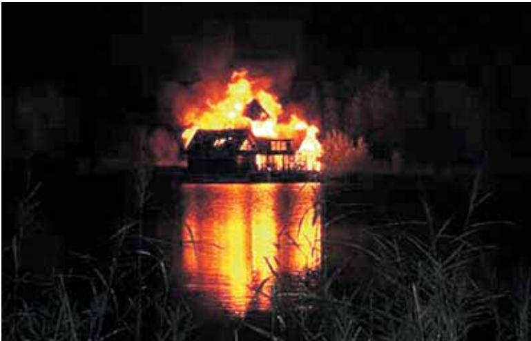
2010-ųjų rudenį sudegė medinė valčių prieplauka