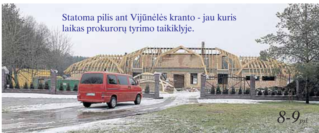
Statoma pilis ant Vijūnėlės kranto - jau kuris laikas prokurorų tyrimo taikiklyje.