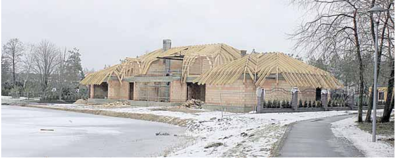
Ant Vijūnėlės tvenkinio kranto kyla prabangus namas