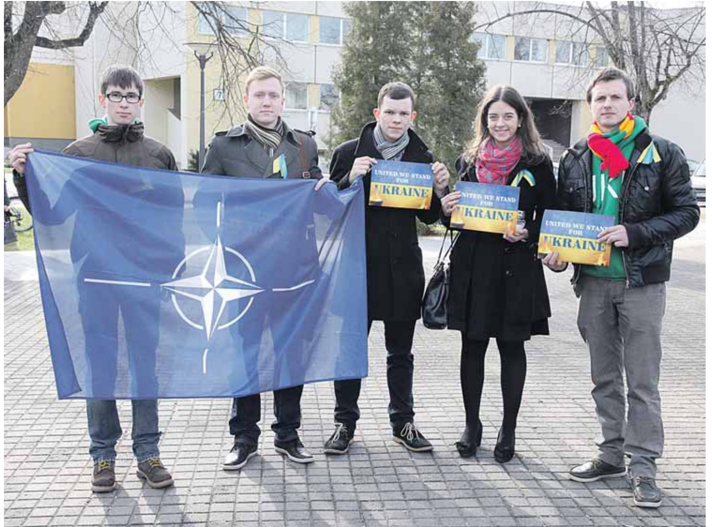
Ukrainiečių drąsą ir kovą už laisvę palaiko Druskininkų jaunimas

Kovo 9-ąją Druskininkuose, šalia paminklo karaliui Mindaugui, taikioje akcijoje maždaug šimtas susirinkusiųjų išreiškė palaikymą Ukrainos kovai už nepriklausomybę bei pasmerkė Rusijos prezidento Vladimiro Putino vykdomą karinę agresiją Kryme