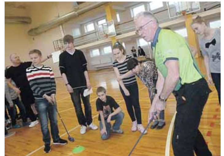
“Atgimimo” mokyklos mokinių ir jų tėvų golfo turnyras

Praėjusį penktadienį skubėjome į „Atgimimo“ mokyklą jau tikrai tautiškai švęsti, pažymėti Kovo 11-tosios.