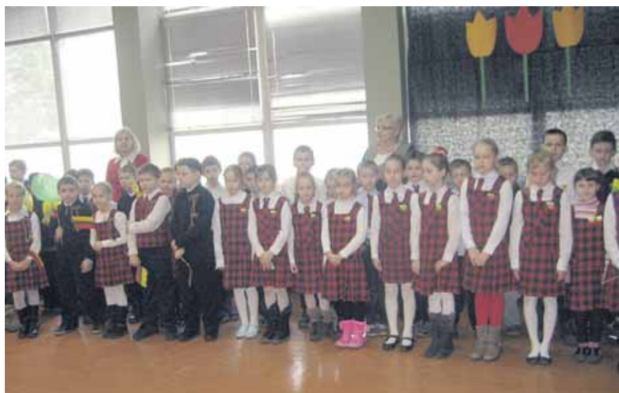
Keli šimtai pradinukų narsiai iškalbėjo ir išdainavo Nepriklausomybės atkūrimą