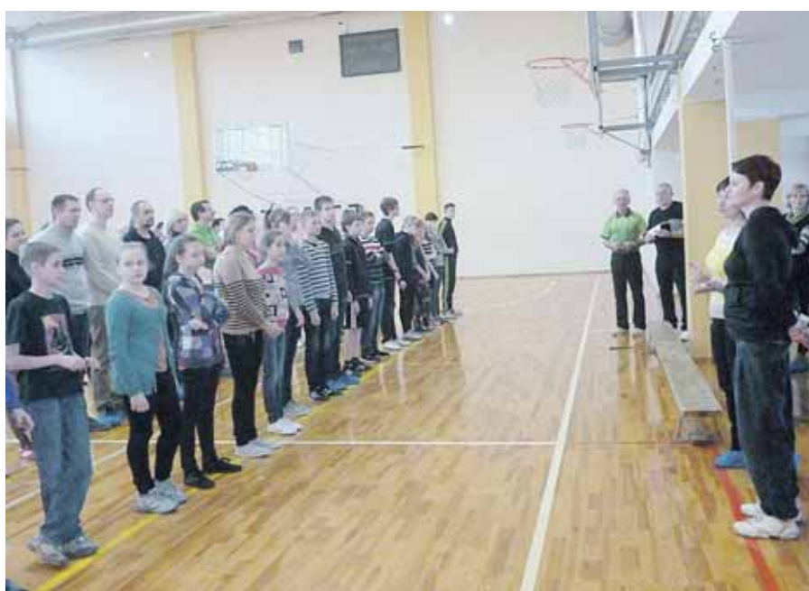
Mokinių ir jų tėvų komandų rikiuotė golfo turnyre