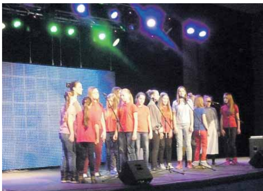
Minėjimas Jaunimo užimtumo centre

mamos. Pralaimėjusių ar nusiminusių kaip ir nesimatė. Už lango šviečianti pavakario saulė ir jau smagiai žalanti žolė priminė tikrus golfo laukus, kuriuose irgi lenktyniauta ant žalių kalnelių ir mokytasi sėkmės svydžių.