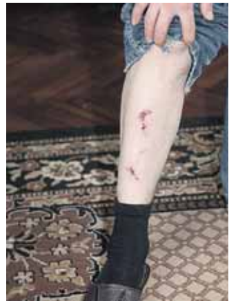
V. Vorobjovas sakė, jog paviešinus žinių apie Rusijos vėliavą, po kelių dienų jis buvo sumuštas

- Tai ir šioje šalyje gyvena jūsų giminaičiai?