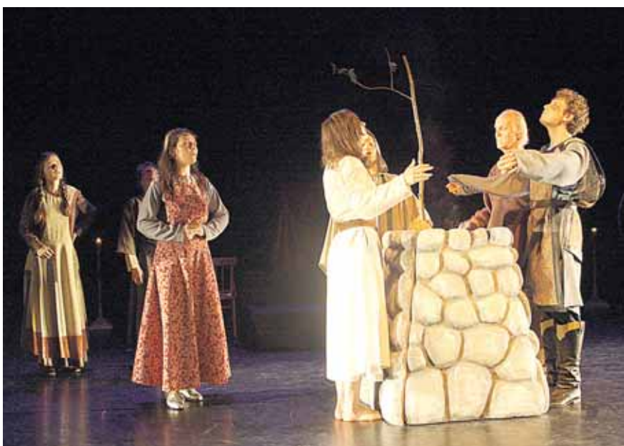
Perkūno apeigos „Naujo teatro“ spektaklyje „Lietuvos vilkė – didžioji kunigaikštienė“, skirtame kunigaikščio Gedimino šeimai, vaidinimo metu užgriaudėjo perkūnija

skanduoju, vaidinant), komunikaciją (tiek verbalinę, tiek neverbalinę), suvokti, kad gyvenimas yra pakankamai neblogas. O kolektyvinė veikla per įgytų įgūdžių refleksiją meditacijų metu padeda kaupti ir tobulinti asmenybės sveikatos resursų išteklius.