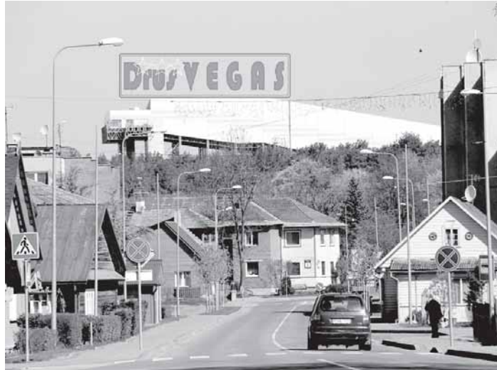
Su mūsų valdžios pramoginėmis ambicijomis tokia vizualizacija galėtų tapti tikrove

Jeigu savivaldybės valdžiukės propagandinis leidinys „Mano Druskininkai“, leidžiamas už mokesčių mokėtojų pinigus, kiekvieną savaitę įrodinėtų, kad Druskininkai nuo 2015 metų pervardinami į Drus Vegą, tai turbūt jau rudenį nemokamą propagandos dozę vartojantys gyventojai įtikėtų, kad taip geriau miestui ir visai savivaldybei. Kaime įtikinėti net ir nereikėtų, nes socialinių išmokų rykštės baimė atliktų savo darbą, ir Druskininkų pervardinimui į Drus Vegą prieštaraujančių neatsirastų.