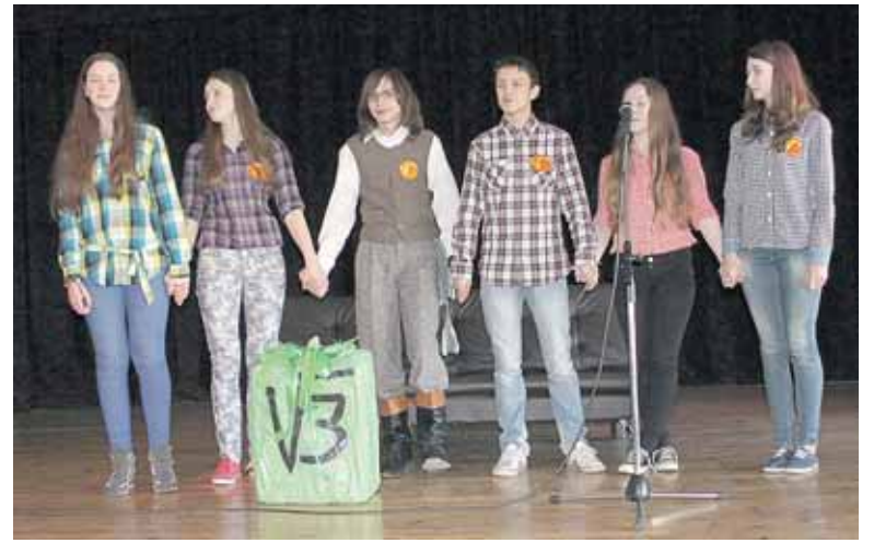
Viktorinos nugalėtoja - gimnazijos 1a klasė

Kovo 14 d. „Ryto“ gimnazijoje buvo minima matematinio skai- čiaus „pi“ diena. Šia proga visoms pirmoms klasėms buvo surengta labai smagi matematinė viktorina. Gimnazistai nepatingėjo specia- liai ruoštis: gamino savo klases pa- laikančius plakatus, o pačios ko- mandos iš anksto turėjo paruošti savo prisistatymą, šūkį, pavadinimą bei pasigaminti savo „kariuo- menės“ narius pristatančias emb- lemas. Kovojan matematiniame mūšyje, reikėjo nemažai paplušė- ti, prisiminti įvairiausių matema- tinius terminus: skritulys, trikampi- sis, parabolė ir t.t. Kad būtų įdo- miau, visi šie žodžiai buvo surašyti ne šiaip sau kokia nors tvarka, bet sumaišyti į vieną „raidžių ka- tilą“. Viktorinoje buvo ne tik logi- nių, bet ir kūrybinių užduočių, pa- vyzdžiui, sukurti trumpą rimuotą eilėraštką, tačiau į jį būtina įterpti