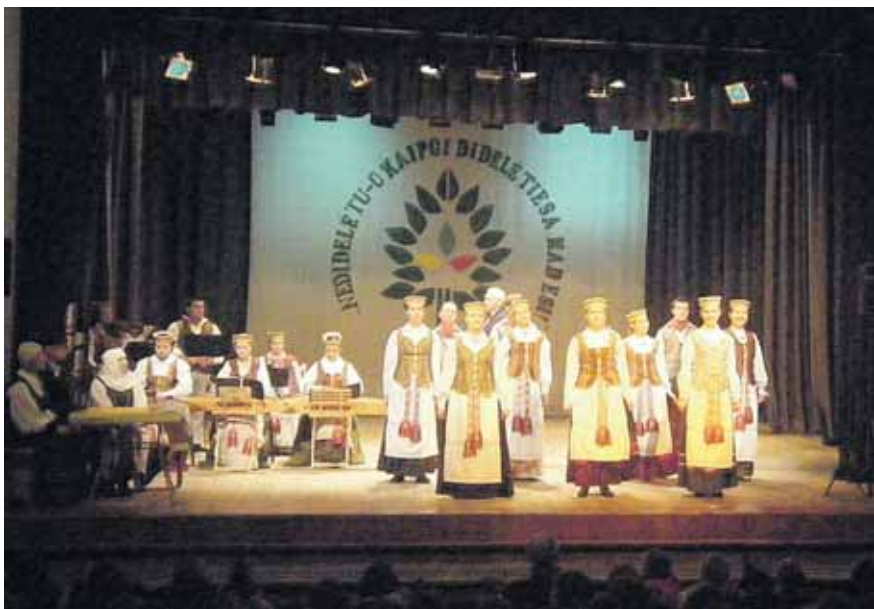
Tragiška mokytojų kursų uždarymo scena spektaklyje „Bitele, skrisk per Lietuvą“, skirtame Gabrielei Petkevičaitėi-Bitei