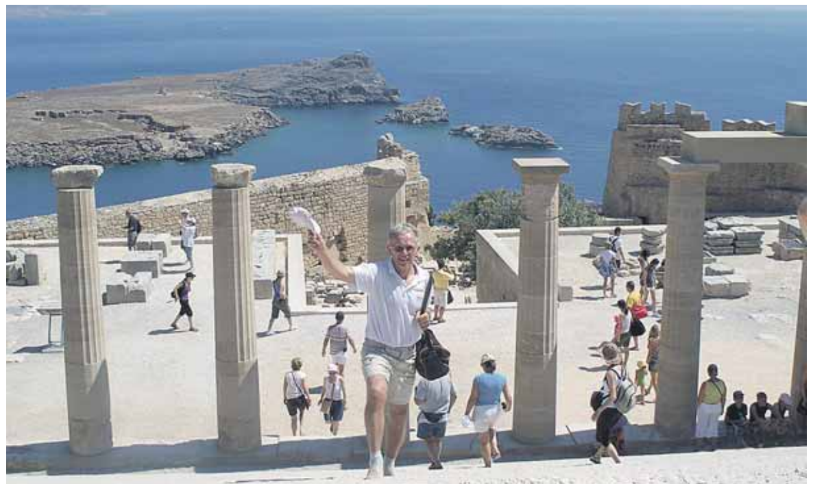
Mokytojas su auklėtiniais

- Daug metų dirbote mokytoju darbu ir dabar tebesate toje terpe, kuri labai įtraukia žmogų ir savotiškai nepaleidžia. Mokytojai retai transformuojasi į verslininkus, politikus, mokslininkus ar kitus visuomenės veikėjus. Net svetimoms šalys jų mažiauia pritraukė. Koks Jūsų požiūris į tokių mokytojų susisąjimą su savo profesija?