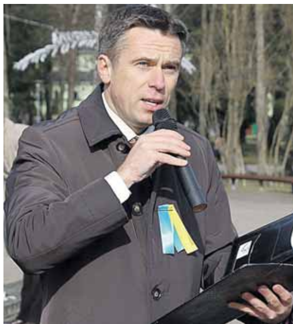
Ukrainos palaikymo akcijoje 2014 m. kovo 9-ąją

tu, todėl pasirinkau ne fortepijoną, bet vokiečių kalbos studijas. Intensyviai mokiausi ir per tris mėnesius pakankamai gerai išmokau vokiečių kalbą, padedamas savo draugo mamos – vokiečių kalbos dėstytojos, kuri, oi, kaip mane spaudė prie knygų. Bet jos dėka F.Goethes institute buvau priimtas iškart į trečiąjį kursą. Kadangi socialinės paramos nepakako pragyvenimui, vakarais dirbau laive restorane-padaavėju, o anksti rytais išnešiodavau laikraščius. Laisvalaikiu, nors ir nedaug jo buvo, dainuodavau Duisburgo chore. Toks buvo mano, aštuoniolikmečio, gyvenimas Vokietijoje.