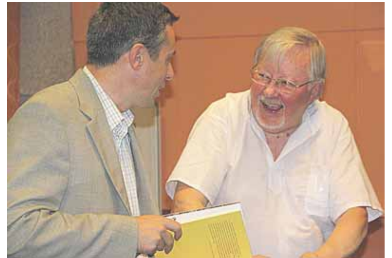
Su prof. V. Landsbergiu vasarą Druskininkuose, M.K.Čiurlionio meno mokykloje

- Bet juk tuo metu nesnaudė ir rusų saugumas, o jūs buvote ne vienintelis, siekęs laisvės gurkšnio.