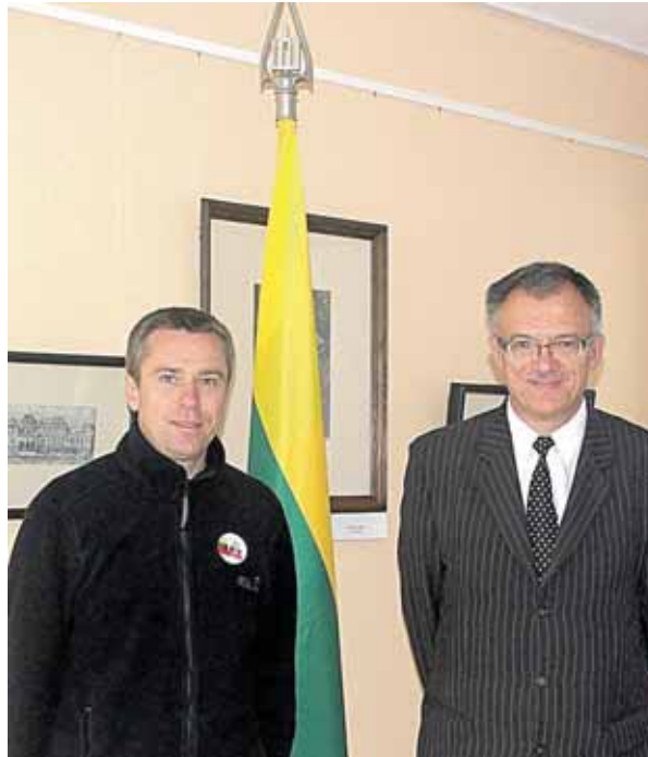
Su Lietuvos ambasadoriumi Ukrainoje Petru Vaitiekūnu (dešinėje)