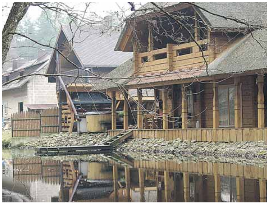
Mero namas Latežeryje tiesiog įbridęs į upę