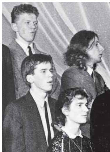
17-metis Vilius V. Tallat-Kelpšos muzikos mokyklos chore

griuvus Rytų ir Vakarų Vokietiją skyrusiai sienai, žmonės išgyveno tikrą euforiją – niekas nekontroliavo praėjimo. Tuo metu nugriauta Berlyno siena, per kurią nevaržomai kursavo žmonės, man buvo vienintelis šansas patekti į Vakarus.