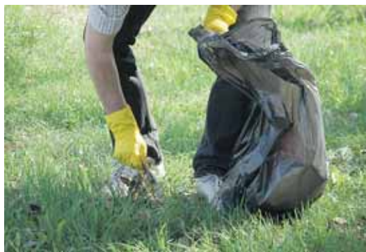
Pavasarinės „Aviva Lietuva“ talkos vyksta jau nuo 2009 metų