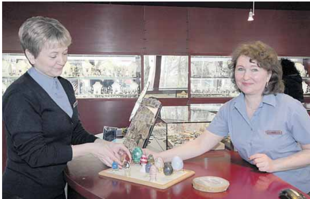
„Kamėjos“ salone galima įsigyti įvairaus dydžio juvelyrinių kiaušinių iš akmens

Prieš Velykas juvelyrinių dirbinių salono „Kamėja“ darbuotojos vitrinose visuomet išpuošia pagrindiniu šios šventės atributu – velykiniais kiaušiniiais iš malachito, jaspio, labradorito, katės akies, lazurito ir kitų mineralų. Akmeniniai margučiai į Druskininkus atkeliauja iš Italijos. „Turime įvairiausių spalvų ir dydžių. Artėjant Velykoms, akmeninių kiaušinių paklausa kasmet auga, todėl jų asortimentas vis didėja ir plėtėja, -