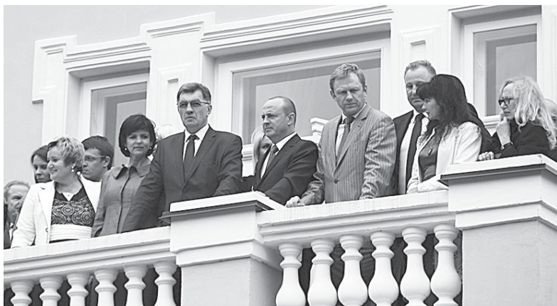
Ar ne metas būtų nuo aukštų balkonų nusileisti ant žemės?

Išgyvenę 1998 metais prasidėjusią Rusijos finansinę/ekonomine krizę, Lietuvos miestai bei gyventojai dėl pasirinktos vakarietiškos Europos Sąjungos bei NATO krypties gavo neįkainojamą paramą. Pažvelkime aplink, beveik kiekvienam naujam ar suremontuotam objektui yra panaudotos ES bendrijos paramos lėšos. O kaip pasikeitė Vilnius, Marijampolė, Telšiai,