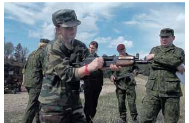
Druskininkų šauliai pratybų metu

tybų metu ugdomos tokios savybės, kaip: kantrybė, disciplina, drąsa, ryžtas, mokėjimas dirbti komandoje, priimti atsakingus sprendimus. Pašnekovas priduria, kad šaulių būryje visi svarbūs, visi ypatingi. Ir džiaugiasi puikiu abipusiu ryšiu, pasitikėjimu vienas kitu. „Nors narių amžius nuo 11-os iki 18-os metų, visi vienas kitam padeda. Visi lyderiai – vienas kitą užkrečia komandos dvasia. Džiugu matyti, kaip itin ilgų žygių metu jie pala-