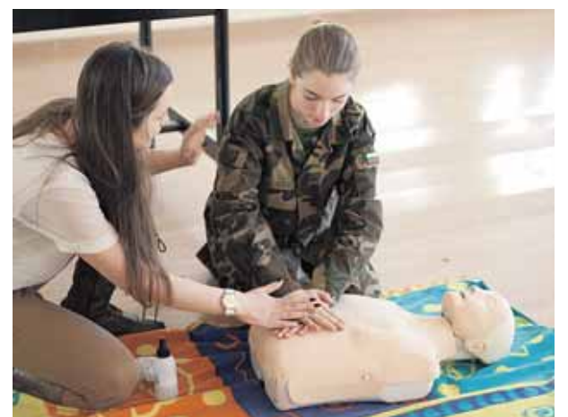
Mūsų šaulė mokosi teikti pirmąją medicininę pagalbą

kariai savanoriai“, - priduria pašnekovas. Jaunieji šauliai taip pat sužino, ką daryti ištikus nelaimę, kokią medicininę pagalbą suteikti. Suteikiamos žinios – ką daryti ir ekstremalių aplinkybių metu, pavyzdžiui, gaisro atveju, kaip tinkamai gesinti vieno ar kitokį gaisrą, o tam reikalingas žinias šauliams suteikia Druskininkų ugniagesiai, kurie visus metus kantriai moko jaunuosius šaulius ugniagesybos. Įvairių žygių, karinių pratybų metu ugdomos tokios savybės,