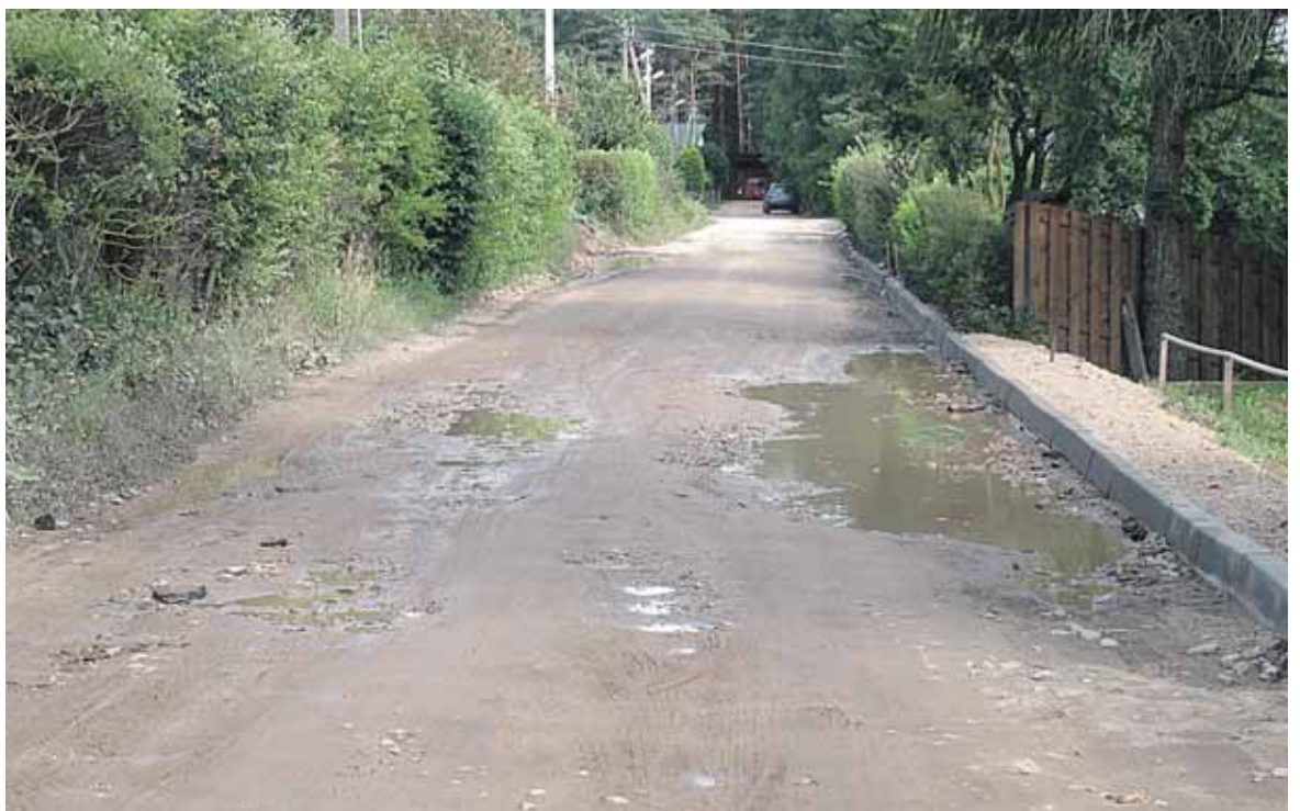
Pagrindinė „Dainavos“ sodų gatvė primena skurdžią Afriką, o ne klestintį kurortą