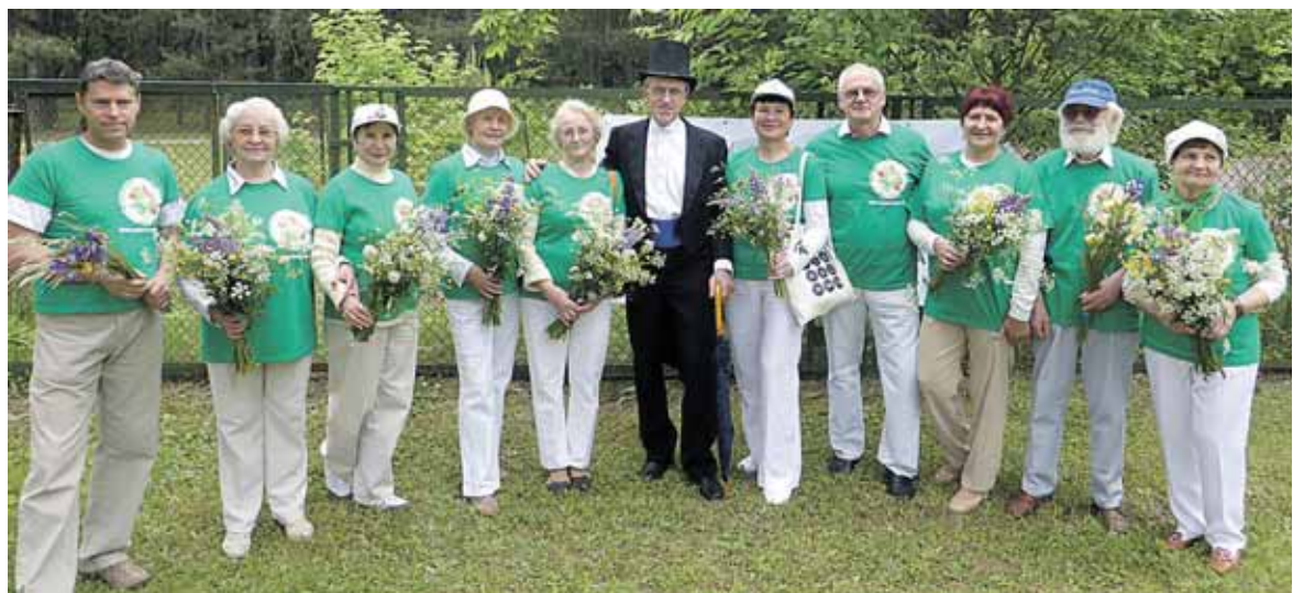
Druskininkų Trečiojo Amžiaus Universiteto kolektyvas kurorto šventėje

daugiau triūso privalai įdėti besiruošdamas vykti į mažytį šalies miestą, kuo daugiau ruošiesi tam susitikimui, tuo gražesnę gauni rezultatą. Juk įdėtas darbas, turėtos viltys pasiteisina. Daugelis mūsų esame gerai patyrę, juo daugiau prakaito išlieji eidamas į tikslą, tuo