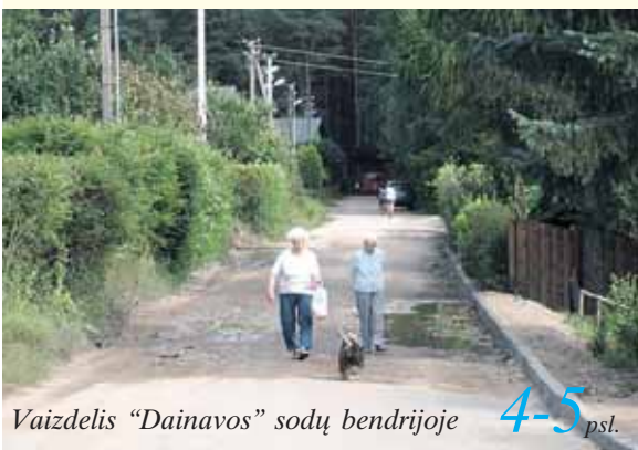
Vaizdelis „Dainavos“ sodų bendrijoje 4-5 psl.