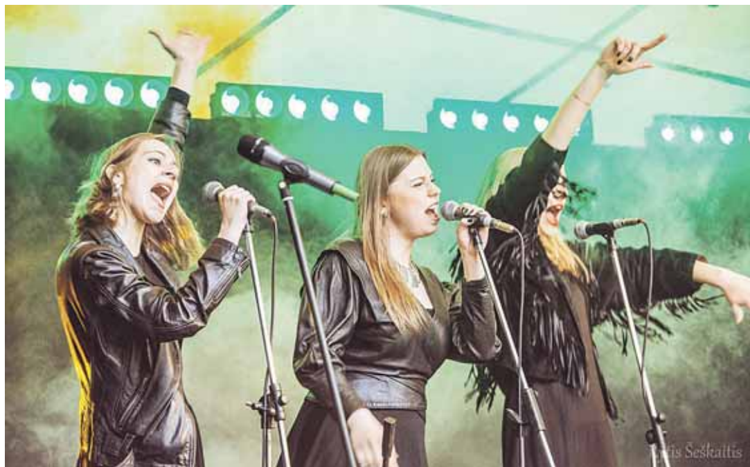
Viltė su psichodelinio orkestro merginomis