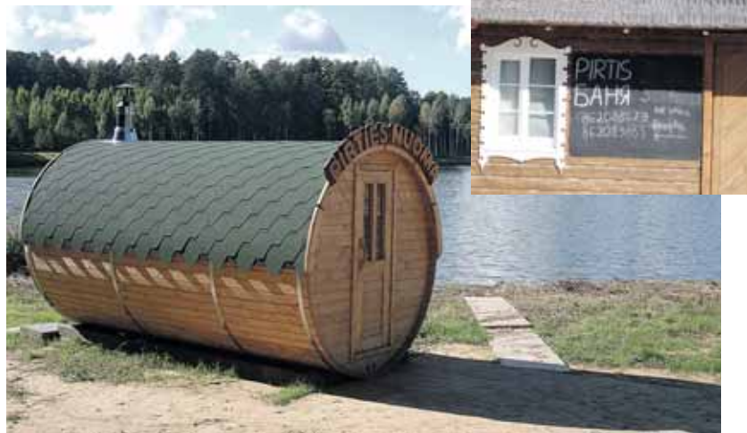
Mobili pirtelė ant Vijūnėlio tvenkinio kranto

nuomos teisė nebuvo numatyta, toje vietoje netrukus atsirado visai kitokio pobūdžio baras neišradingu pavadinimu “Beach bar”. Ar žuvies restoranas lankytojų taip ir nesudomino? O gal šitos vietos reikėjo žymiai svarbesniam nei kaimynas žmogui?