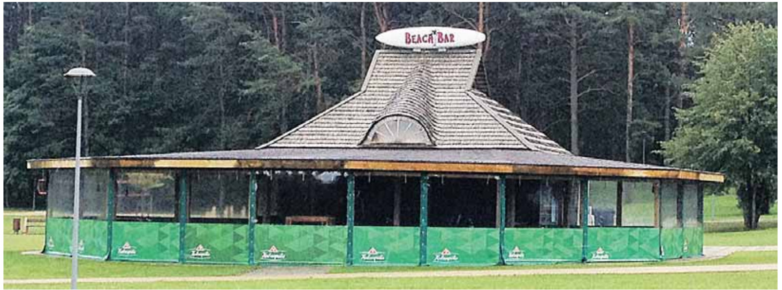
ES pinigais išpuoselėto Vijūnėlio parko teritorijoje, padidinus plotą lauko terasa, išdygo nemažas statinys primityviu pavadinimu