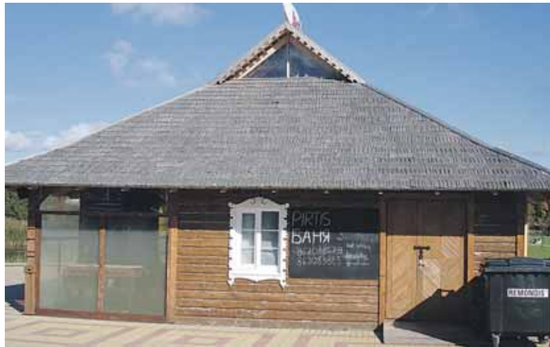
Žuvies restoranas atrodė taip