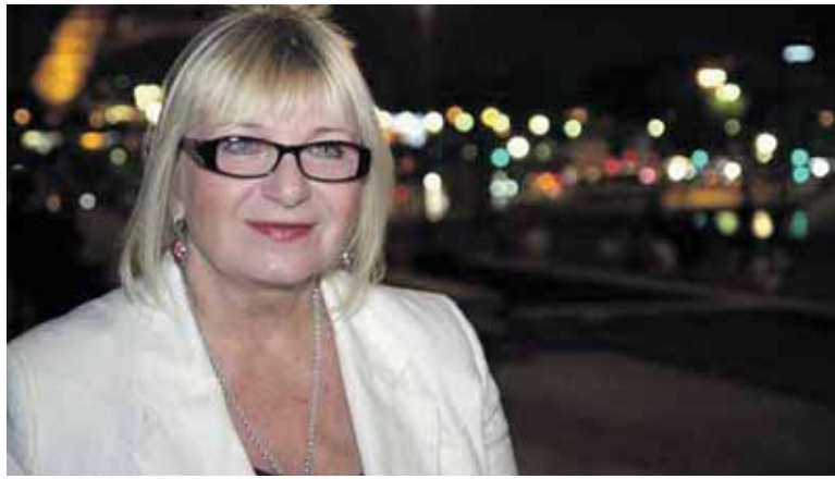
Laidos „Emigrantai“ stop kadras

S olidaus amžiaus sulaukusi, sunkias ligas įveikusi druskininkietė nepabijojo iššūkių ir išvyko ieškoti darbo į užsienį. Anglija jai nepatiko, bet užtat Paryžius moterį sužavėjo: čia ji trejus metus dirbo auklyte ir dabar nenuleidžia rankų – tikisi rasti darbą ir gyventi Prancūzijos sostinėje, kol, kaip ji sako LRT televizijos laidoje „Emigrantai“, širdis ne lieps grįžti į Lietuvą.