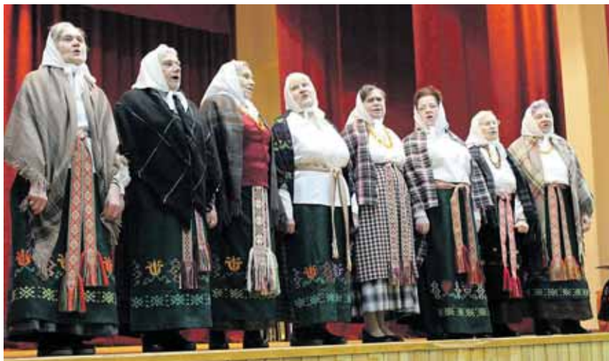
Viečiūnų laisvalaikio salės folkloro grupė