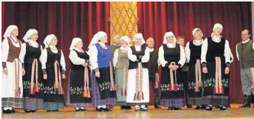
Leipalingio laisvalaikio salės folkloro ansamblis “Serbenta”