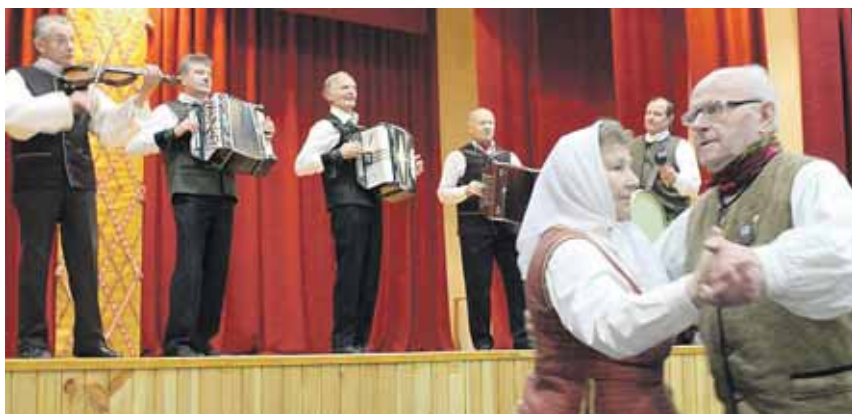
Griežia Leipalingio laisvalaikio salės liaudies muzikantai