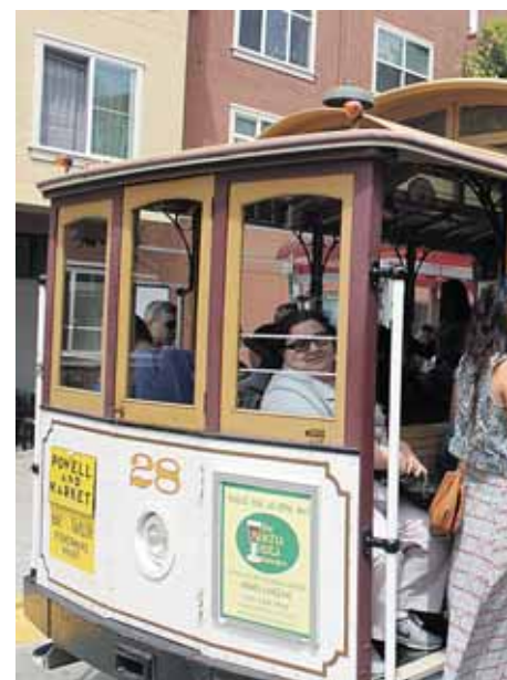
Apsilankymas San Franciske