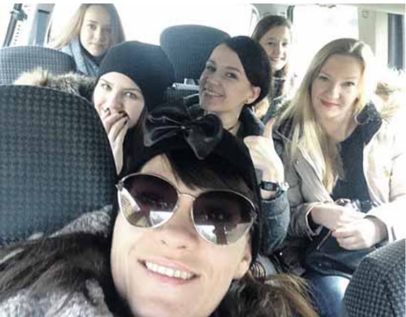
Lietuvių komanda Italijoje