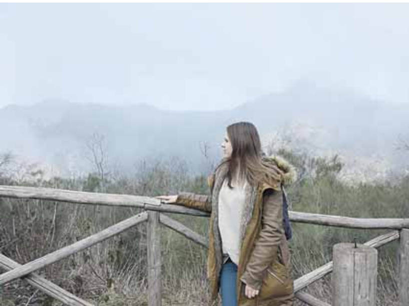
Lipant į Vezuvijų