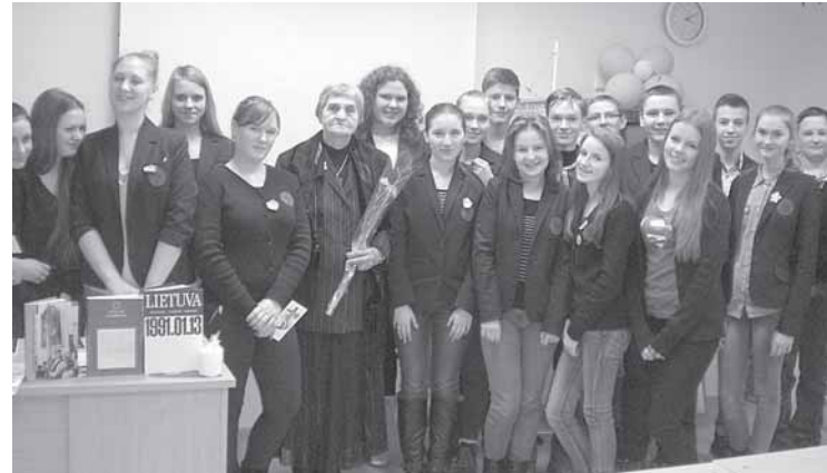
Gimnazistų 1 ę ir 2 d klasių su viešnia Genovaite Čiurlioniene

Sausio 13-osios rytą visuose gimnazijos languose mokiniai kartu su mokytojais uždegė žvakelės, o į uniformas įsisėgė mėlyną neužmirštuolės žiedelį, kuris