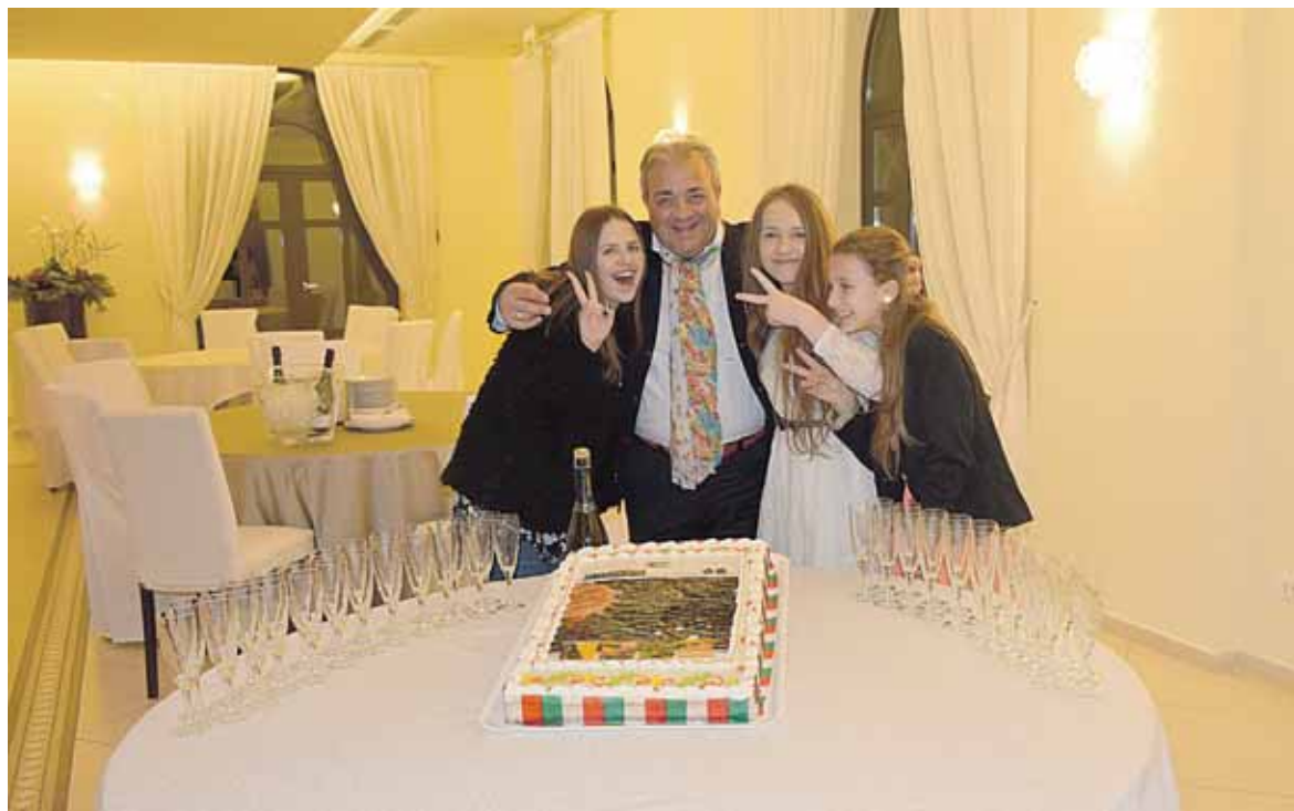
Su konkurso organizatorium ir lietuvaitėmis

- Atvykus, sekančią dieną, t.y. sausio 3-ąją, prasidėjo 10-12 metų ir 13-16 metų kategorijų pasirodymai. Po ilgo laukimo ir greitos repeticijos konkursas prasidėjo. Be dainavimo technikos, organizatoriai vertino improvizavimą bei bendravimą su publika. Jie linkėjo visiems konkursantėms didžiausios