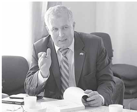
Seimo narys Arvydas Anušauskas

Mat opozicija, priekabaudama prie mero, tvirtino, kad artėjant rinkimams laikraštyje pasipylė jam ir jo partijai palankios publikacijos, kurias galima laikyti paslėpta reklama. VRK darbo grupė nustatė,