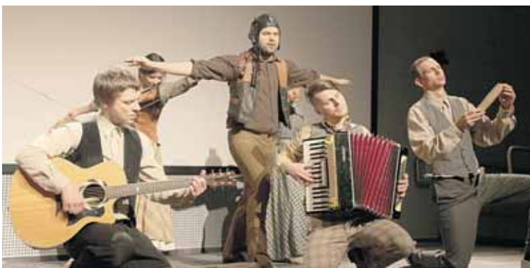
„Atviro rato“ aktoriai spektaklyje „Sparnuotasis Matas“