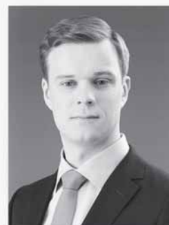
Gabrielius LANDSBERGIS Europos parlamento narys

2015 02 27 d., 17 val. 30 min., Viešbučio SPA Vilnius SANA konferencijų salėje Politikos atsinaujinimo svarba: nuo Bruselio iki Druskininkų