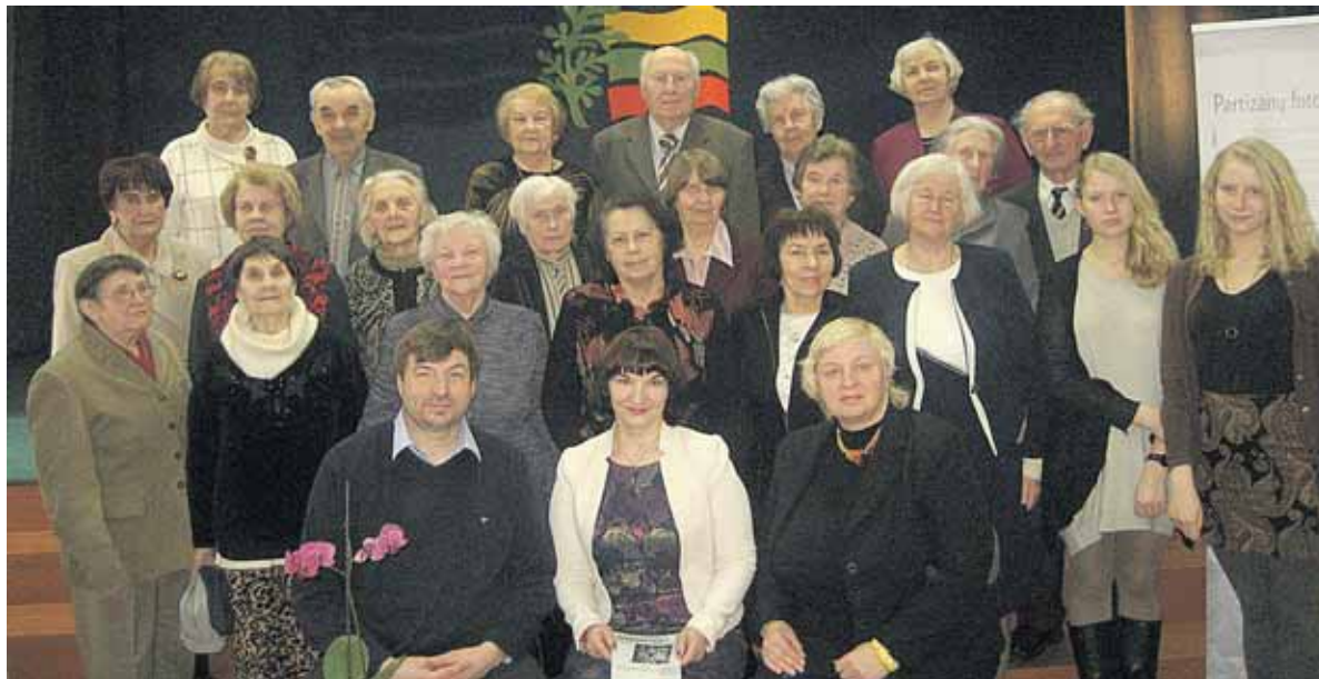
„Bičiulių“ klubo nariai su renginio svečiais