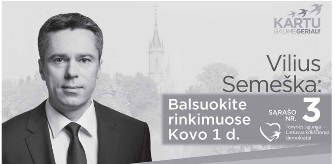
Politinė reklama bus apmokėta iš Lietuvos Respublikos TS-LKD rinkimų kampanijos sąskaitos. Užsak. Nr. 8/5