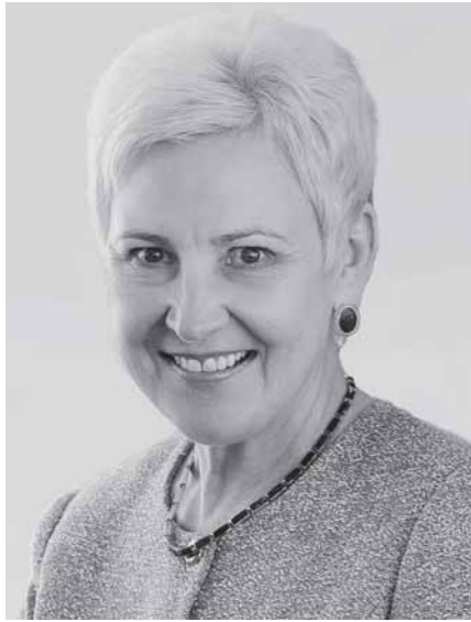
Irena DEGUTIENĖ, Lietuvos Respublikos Seimo Pirmininko pavaduotoja, TS-LKD partijos pirmininko pirmoji pavaduotoja