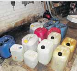
Neravų g. 37B aptiktieji degalai

Dėl šio įvykio pradėta administracinės bylos teisena pagal Lietuvos Respublikos administracinių teisės pažeidimų kodekso atitinkamą straipsnį (bauda nuo 868 eur iki 8688 eur su naftos produktų konfiskavimu arba be konfiskavimo).