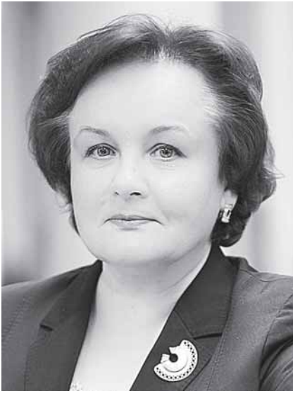
Doc. dr. Laima ANDRIKIENĖ, Kovo 11-osios Akto signatarė

Gimtųjų Druskininkų žmonės, seni mieli pažįstami, mano mokytojai, bendramoksliai, kaimynai, o taip pat tie, kurių nepažįstu, bet kurie šiandien esate Druskininkų gyventojai ir Lietuvos piliečiai!