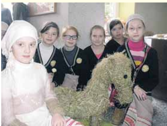
Kovo 6 d. Viečiūnų pagr. mokykloje vėl šurmuliavo Kaziuko mugė