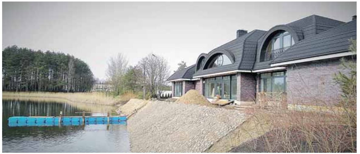
Per metus didelio namo ant Vijūnėlės kranto karkasas (nuotr. apačioje) tapo prabangiu rūmu (nuotr. viršuje)

Pernai kovo 10 d. Generalinė prokuratūra vis dėlto patenkino