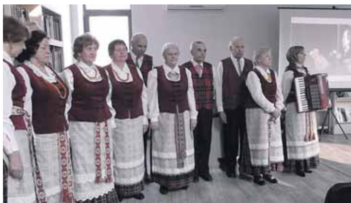
„Bočių“ dainininkai sudarė gražų muzikinį foną ir papildė renginį patriotinėmis dainomis