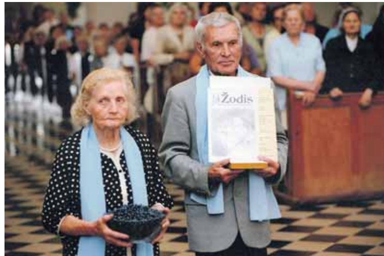
Marijampolėje pristatant laikraštį „Zodis“ - atnaša per šv. Mišias