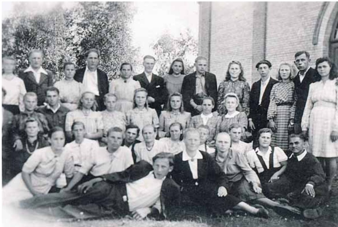
Neravų kaimo jaunimas prie Ratnyčios bažnyčios 1948 m.