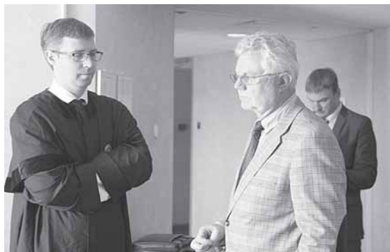
Statybas teisme gina statytojų ir savivaldybės advokatai