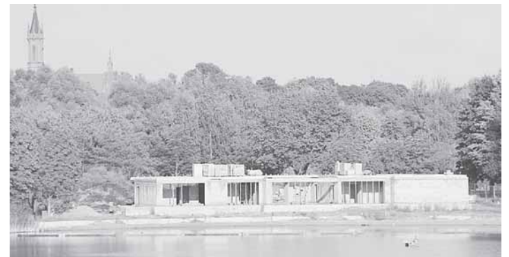
Namo kontūrai 2013-ųjų rugpjūtį