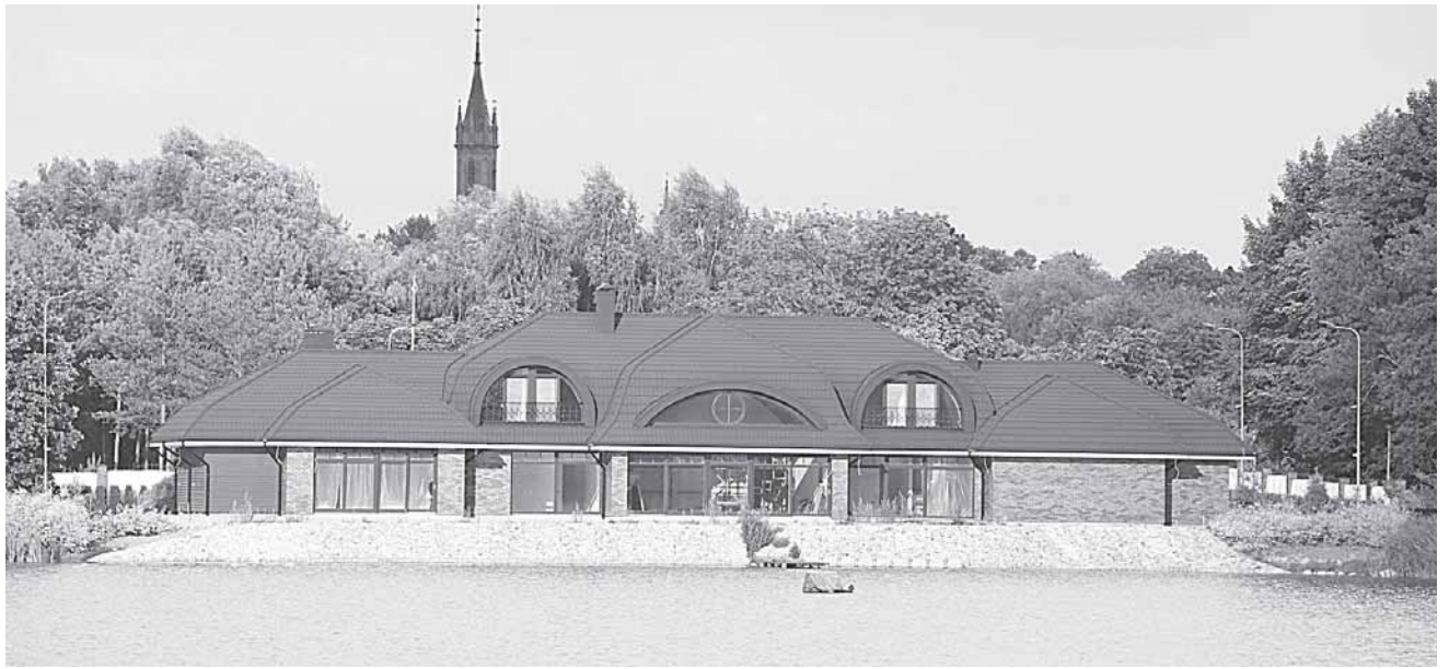
Taip šiandien atrodo prabangusis namas ant Vijūnėlio tvenkinio kranto