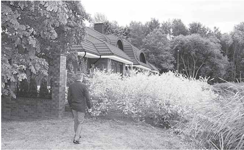
Kaip praeiti Vijūnėlio tvenkinio pakrante per tankią krūmų sieną?

Tačiau kantrybė senka ir druskininkiečiams. Opozicijai priklausantys Druskininkų savivaldybės tarybos nariai bei aplinkosaugininkai, gavę nemažai kuror-