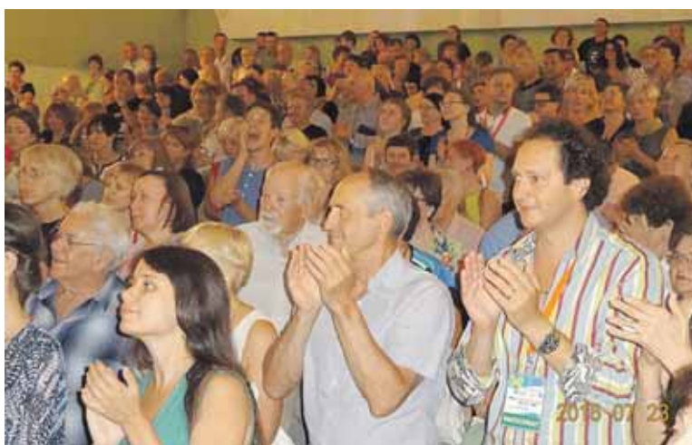
Kai kurie festivalio renginiai netalpino visų norinčių