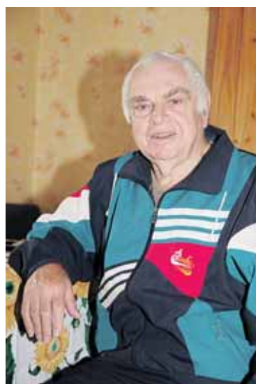
Semionas iš Izraelio vis dar laisvas

Moterys, kur jūs: vyrams iš Izraelio reikia ir darbštuo- lių, ir gražuolių