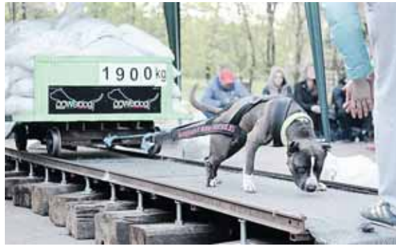
Šunų jėgos varžybose