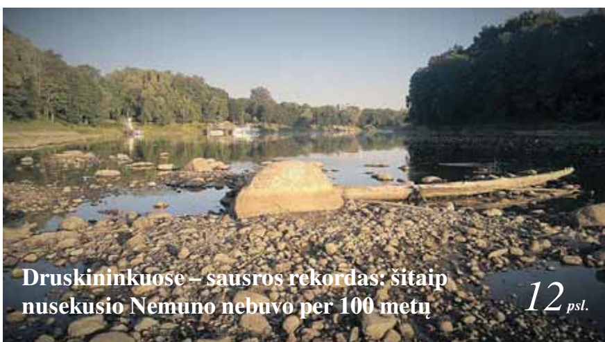
Druskininkuose – sausras rekordas: šitaip nusekusio Nemuno nebuvo per 100 metų