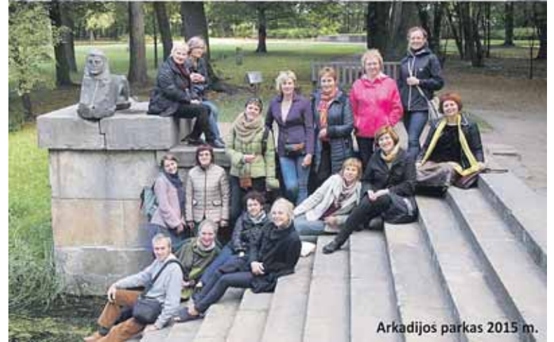
Arkadijos parke 2015 m.