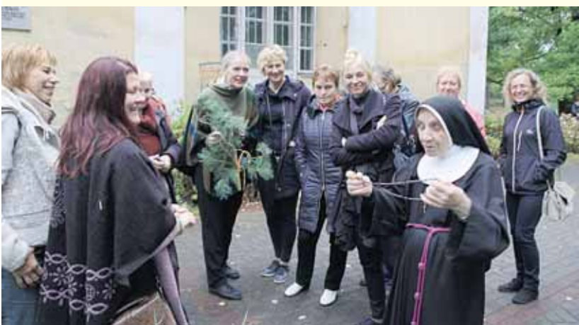
Druskininkiečių susitikimas su vienuole Pustelnikuose, kur Lenkijoje mirė M.K.Čiurlionis

Išvykos Čiurlionio gyvenimo keliais įkvepia