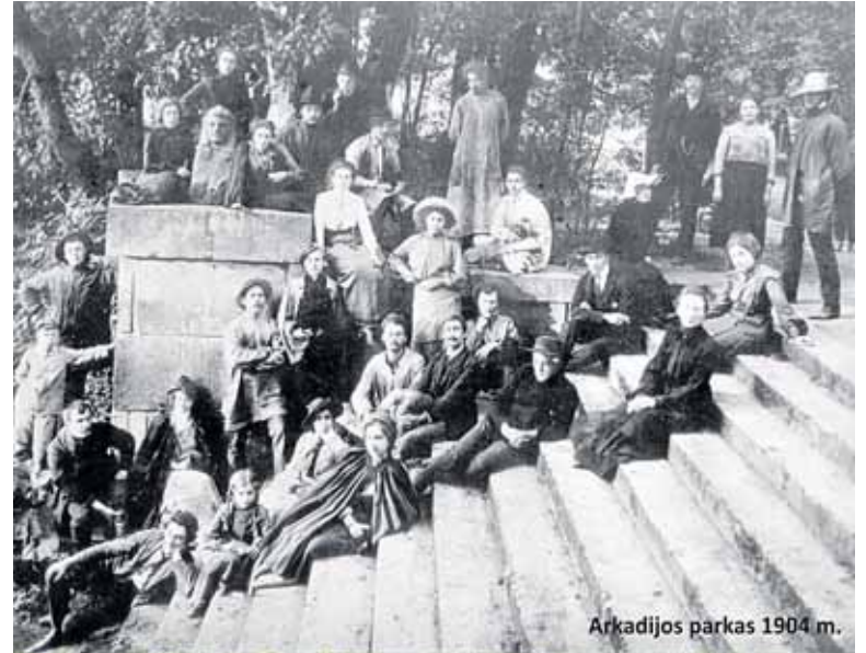
Arkadijos parkas 1904 m.

šakėles, perjuostas trispalvės juostelėmis. Rugsėjo kelionei į Varšuvą ruošiausi atsakingai, kruopščiai. Į pagalbą pasikviečiau kolegę gidę iš Kauno, kuri vedė mus šviesuolių keliais Žemaitijoje. Svarstėme, ieškojome šiame krašte vietų, kurios sietųsi su mus dominančiomis asmenybėmis. Guzovo dvaras, kuriame prieš 250 m. gimė M. K. Oginskis, Arkadijos parkas, įkurtas Elenos Radvilienės XVIII a., kur, besimokydamas Varšuvos dailės mokykloje ( 1904 m.), čionai su kitais studentais į vasaros tapybos plenerą buvo atvykęs Čiurlionis. Ir galiausiai labiausiai jaudinanti vieta - Pustelnikai. „Raudonojo dvaro“ sanatorija, paskutinieji M. K. Čiurlionio namai. Pustelniko vardu tuomet vadinta sodyba dvasios negandų ištiktiesiems netoli Markų miestelio. Čiurlionis čia praleido daugiau nei metus. Šiandien nedaug tikslų žinių, kaip tas laikas praėjo, kokie gydymo metodai taikyti. Atrodė, viskas galėjo baigtis gerai - metų pabaigoje kalbėta apie sveikatos pagerėjimą, kintinta išrašyti Čiurlionį namo. Deja, ankstų 1911 m. pavasarį daili-