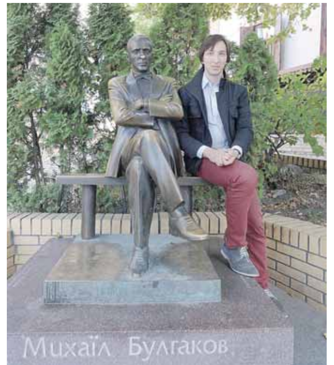
Išsipildė Konstantino svajonė aplankyti rašytojo Michailo Bulgakovo namą-muziejų