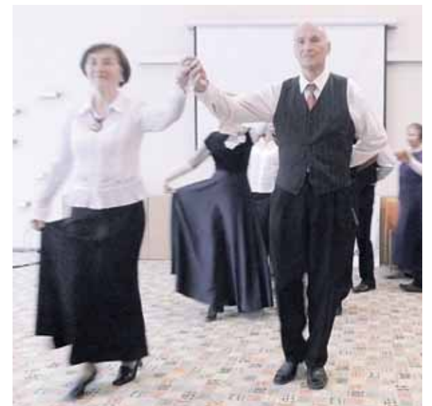
III amžiaus universiteto rektoriaus Jono Valskio polonezas mokslo metų atidarymo šventėje