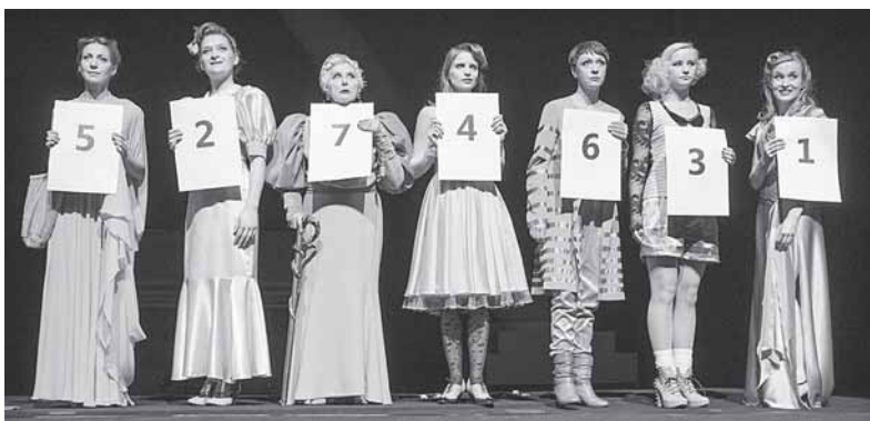
„8 mylinčios moterys“

Spalio 13 d. 18 val. Valstybinio jaunimo teatro spektaklis „8 mylinčios moterys“.