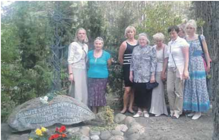
Prie M.K.Čiurlionio dukros Danutės Čiurlionytės-Zubovienės kapo Petrašiūnų kapinėse