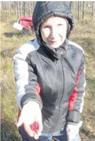
Uogos iš Čepkelių raisto