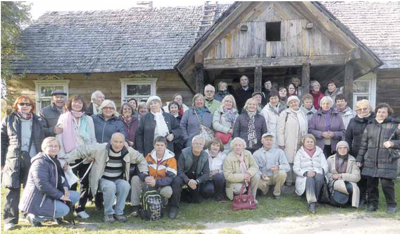
Druskininkų III amžiaus universiteto mokslo metų pradžia Dzūkijos nacionaliniame parke