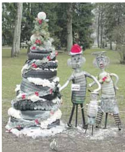
Autoservisas “A.Navickas ir Co”