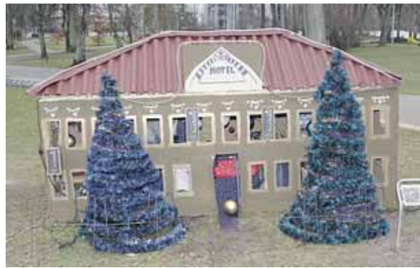
“Hotel Best Baltic”

Fotoreportažas iš Druskininkų kalėdinių eglių parko.