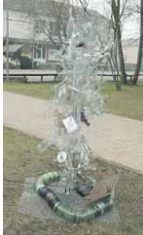
M.K.Čiurlionio meno mokykla