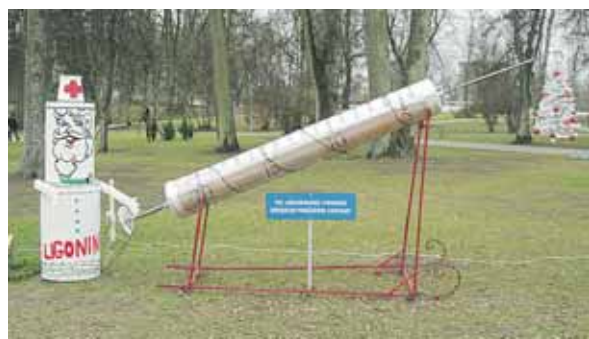
Druskininkų pirminės sveikatos priežiūros centras ir ligoninė