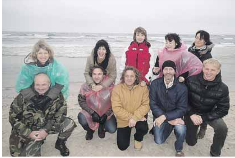
Šokių pamokas pamėgę ir vyresnio amžiaus žmonės