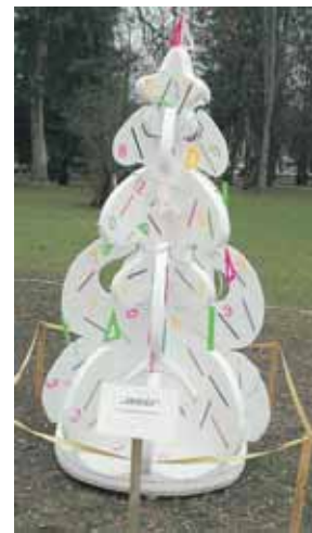
“Saulės” pagrindinė mokykla