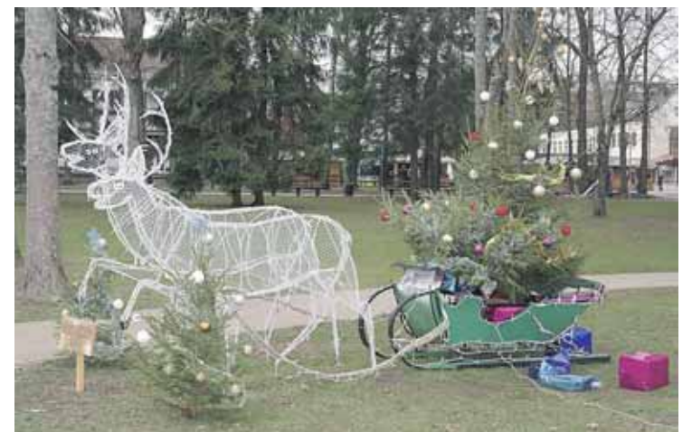
Druskininkų miškų urėdijos eglutė

Fotoreportažas iš Druskininkų kalėdinių eglių parko