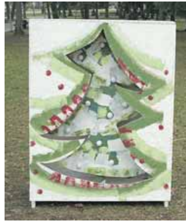
Deivido rėminimo studija