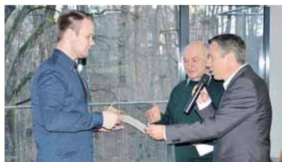
Gruodžio 6 d. Tėvynės sąjungos – Lietuvos krikščionių demokratų partijos Druskininkų skyriaus nariai rinkosi į tradicinę Advento vakaronę