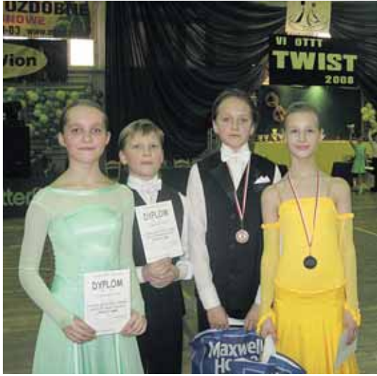
„Rock-rock“ šokėjai skina laurus tarptautiniuose konkursuose