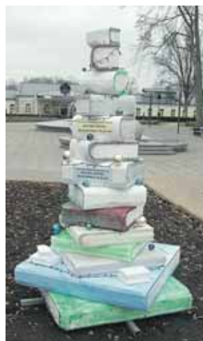
Vilniaus Žirmūnų darbo rinkos mokymo centro Druskininkų filialas