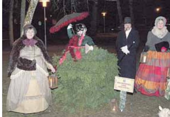
Druskininkų gidų asociacija