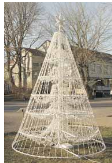
Sveikatingumo ir poilsio centras “Aqua”