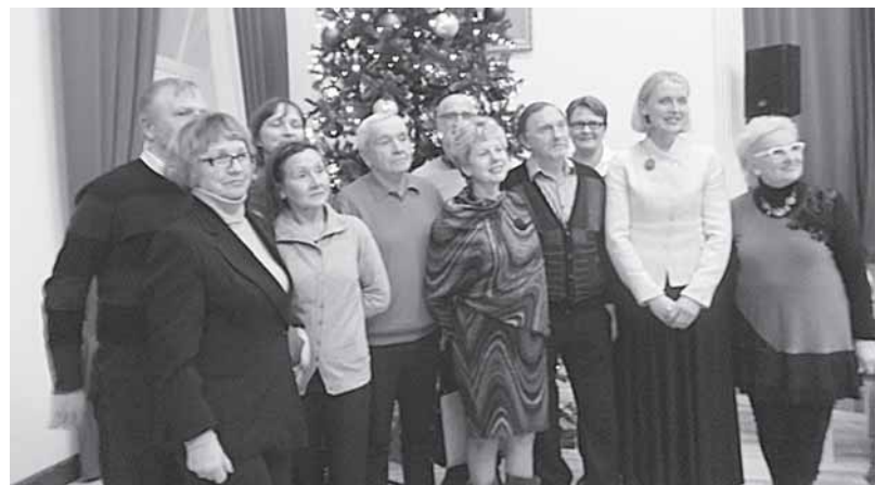
Renginio svečiai su druskininkiečiais

Ar matytas filmas pateisino žiūrovų lūkesčius? Tą palieku spręsti