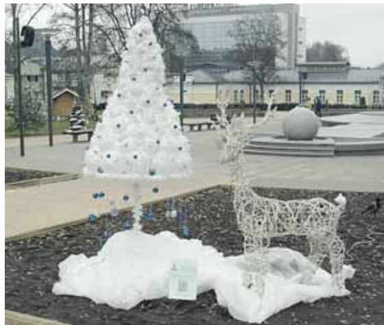
“Grand Spa Lietuva”