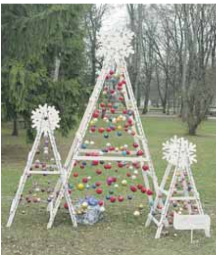
“Atgimimo” pagrindinė mokykla