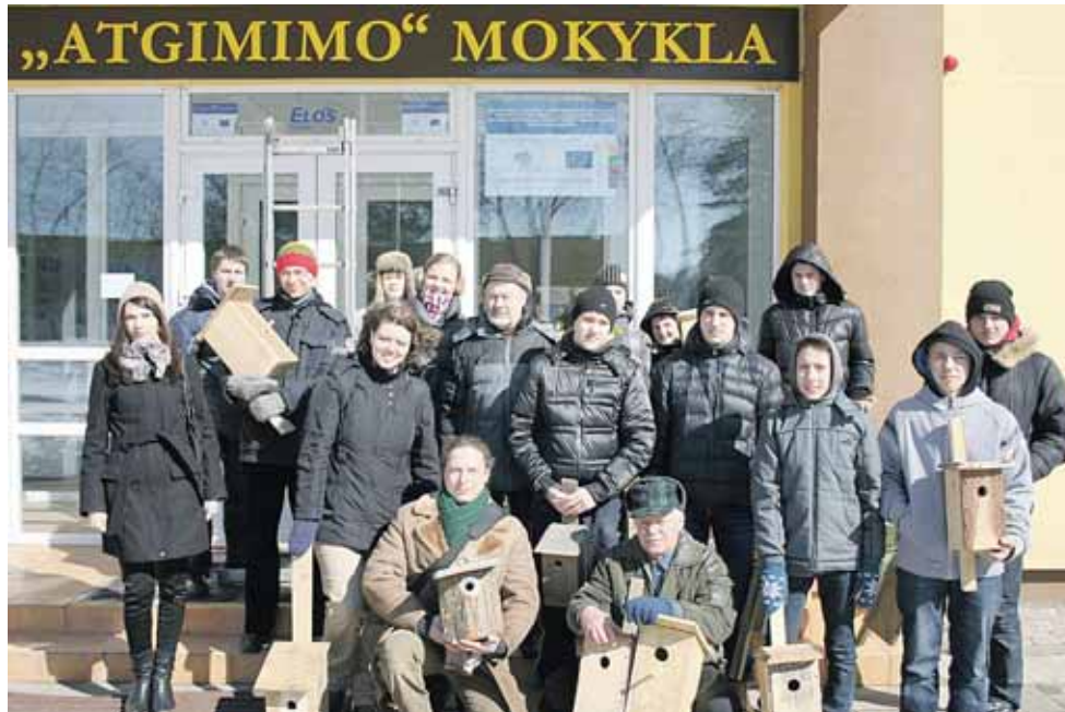
Druskininkų žalieji su mokiniais inkilų akcijoje