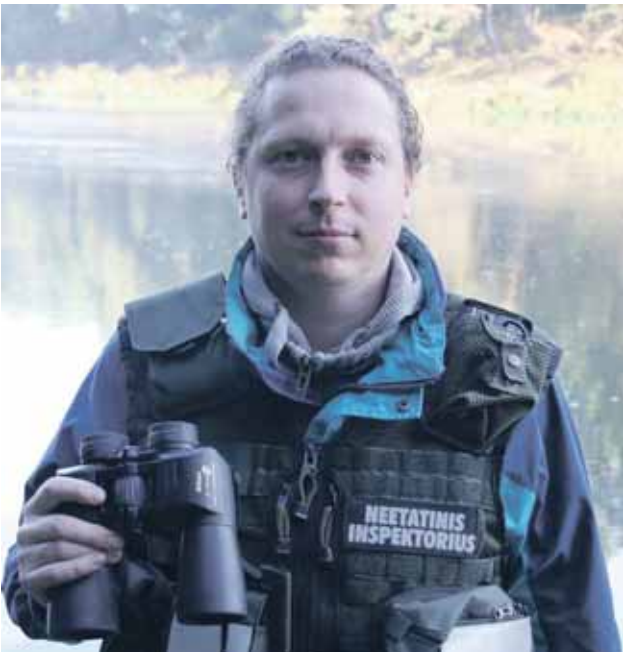
Neetatinis aplinkos apsaugos inspektorius