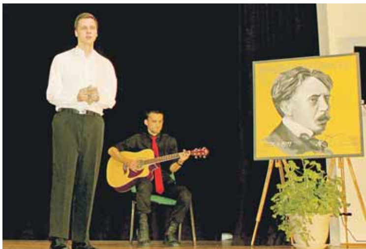
Teatro kompozicija, priminusi M.K.Čiurlionio meilės istoriją