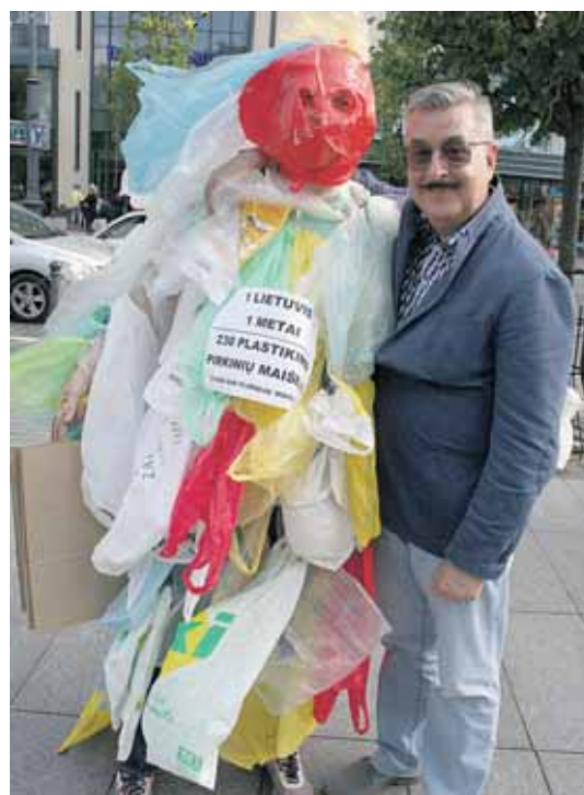
Maišelių monstrų akcijoje