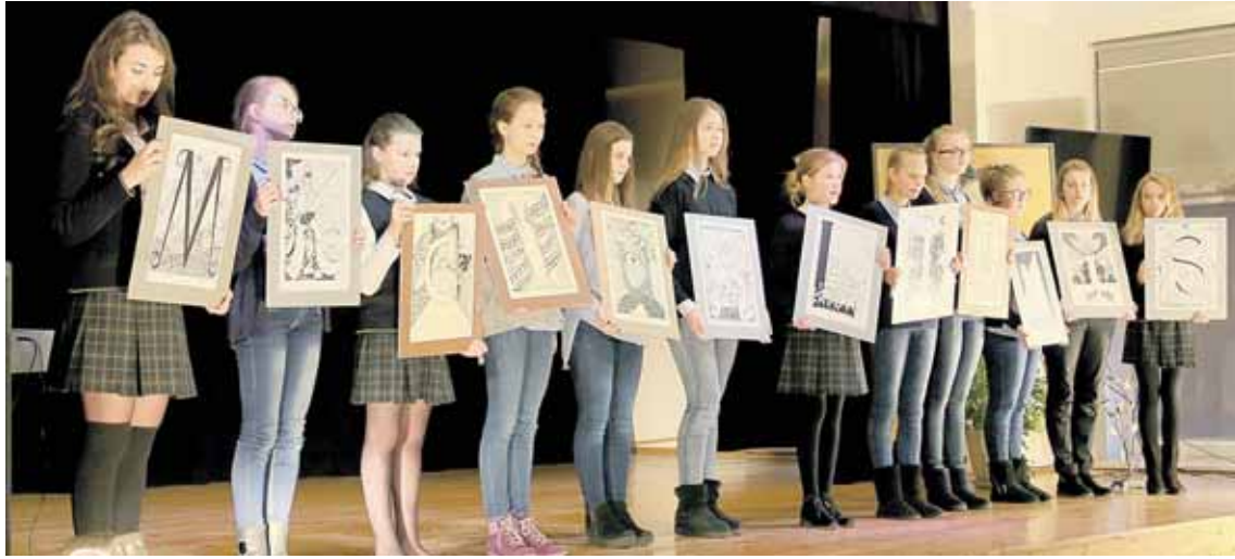
Iš raidžių piešiniuose susidėjo menininko inicialai ir visa pavardė

Nors renginys vyko jau besibai-giant penktadienio pamokoms ir gana ilgai užtruko, pilnoje mokinių ir mokytojų mūsų gimnazijos salėje kartu praleistas laikas neprailgo. Renginį išradingai, nuoširdžiai vedė buvęs Mažeikių muzikos mokyklos direktorius,