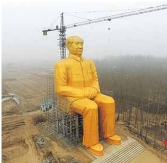
Visai neseniai kinai buvo pastatę auksu tviskančią 36 metrų aukščio Kinijos liaudies respublikos įkūrėjo Mao Dzedongo statulą