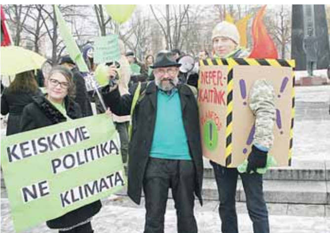
Klimato kaitos žygio dalyviai