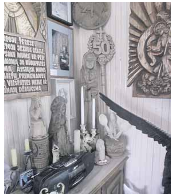
Medžio drožiniai trobelėje