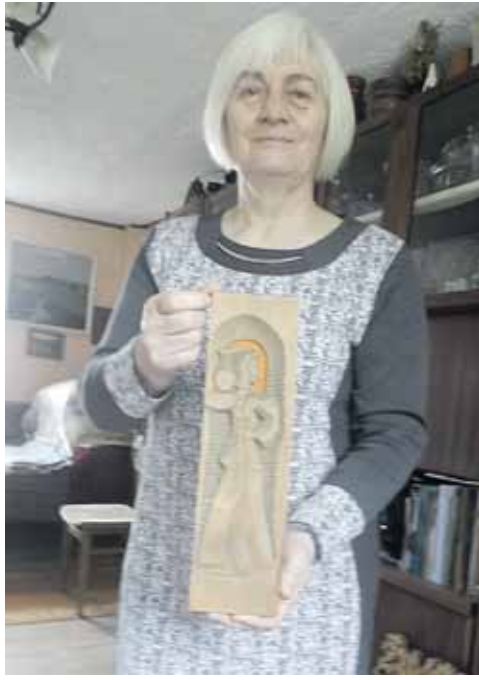
Pirmasis medžio drožinys „Rytmetinė rasa“