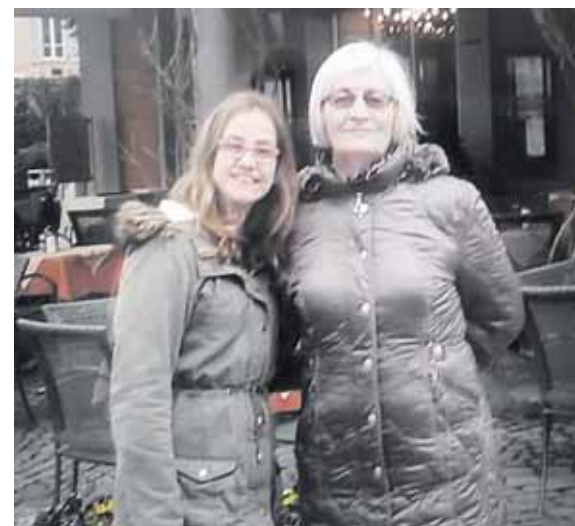
Su anūke Vokietijoje