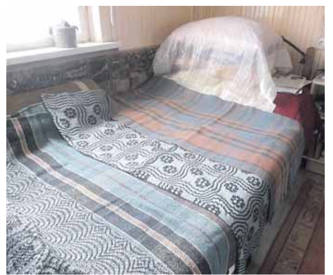
Monikos rankų audiniai - lovatiesės