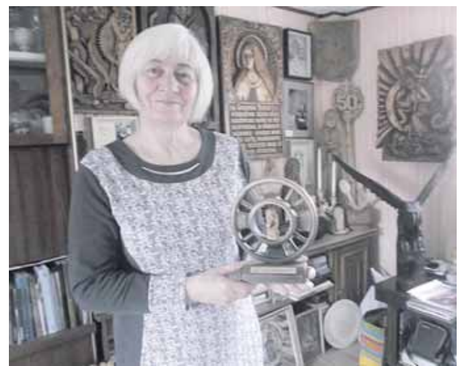
Prizas Ratnyčios parapijos šviesuolei