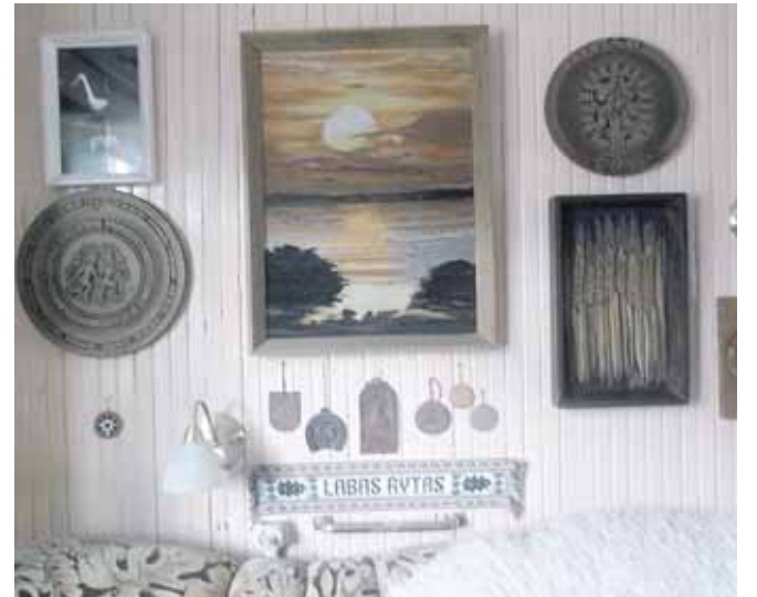
Gobelenai, juostos ir dekoratyvinės lėkštės