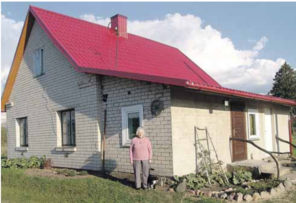
Šalia savo namų Vilkanastrų kaime