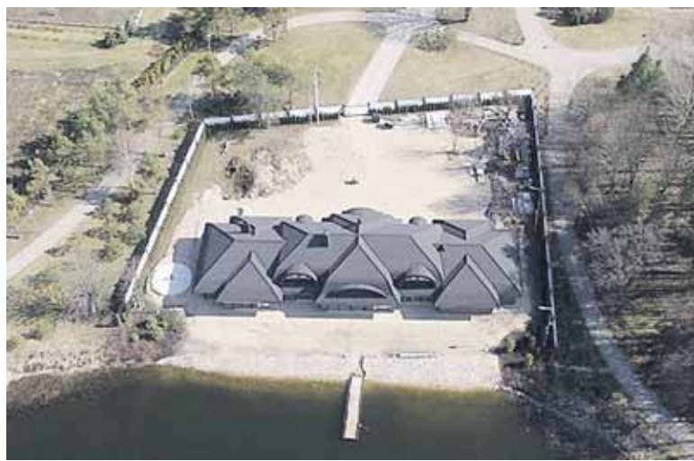
Centriniame Druskininkų parke išaugo privatūs rūmai – vadinamas Vijūnėlės dvaras

Kovo mėnesį teismas prašymą priėmė, o apie tai paskelbus oficialiai, Vyriausybės nutarimo galiojimas buvo sustabdytas. Be kita ko, teismas nurodė, kad vadovaujantis įstatymais, tokio prezidentės prašymo nagrinėjimas paankstinamas. Premjeras Algirdas Butkevičius visa tai žinojo, tačiau nusprendė nelaukti, ką apie įtartinus Vyriausybės narių veiksmus, naudojantis suteiktais įgaliojimais, pasakys KT. Jis pavedė į skandalą įsipainio-