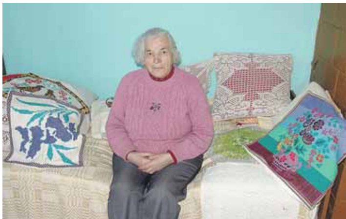
Tarp savo nėrinių, audinių, siuvinių