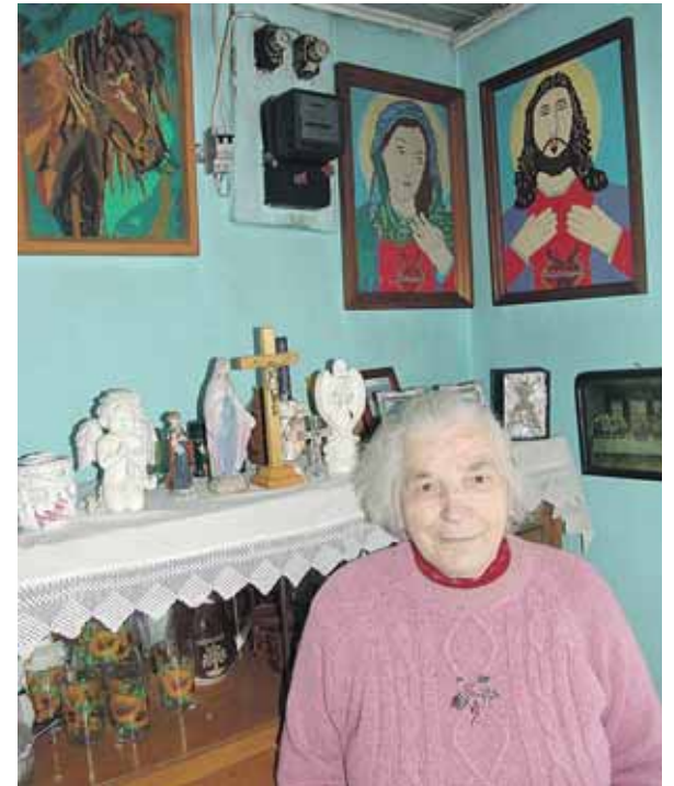
Prie siuvinėtų paveikslų

likusieji – daugiausiai iš Kauno poilsiauti atvykstantys ar kaimo turizmu užsiimantys. Tarkim, garsios šių vietų poilsiavietės – Vilkanastrų dvaras arba Baltajo Bilso sodyba.