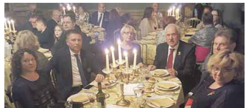
Iškilminga vakarienė Popiežiaus audiencijos išvakarėse