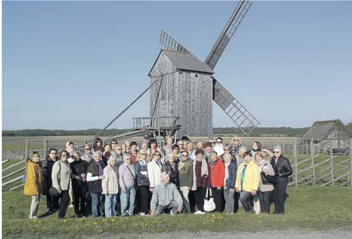
Druskininkų trečiojo amžiaus universiteto lankytojai vėjo malūnų komplekse