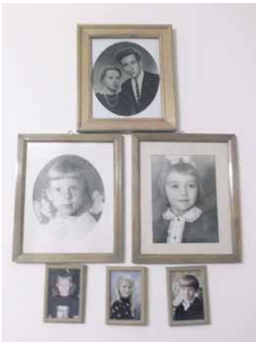
Ant buto sienos - artimųjų nuotraukos iš praeities